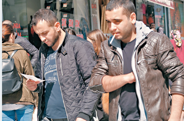
途人細閱反對修憲的宣傳單張。