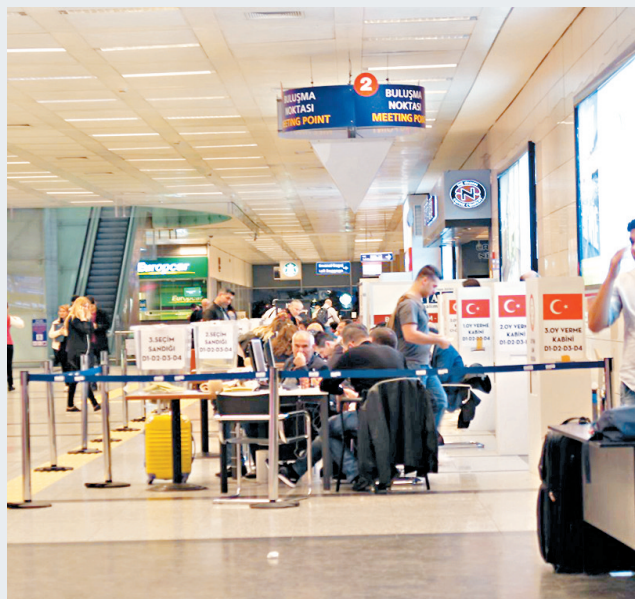
阿塔圖爾克機場設有投票站。

企業管理顧問公司Global Source Partners的土耳其專家耶希拉達認為，AKP不少支持者經營小企業，但現行經濟政策不利營商，令支持者考慮再三。耶希拉達相信，若修憲公投獲通過，有助穩定土耳其政局，短期內仍可吸引投資者，但當地面臨政府赤字龐大、儲蓄率低、正式職位缺乏等問題，修憲通過反而令這些問題變得嚴重。