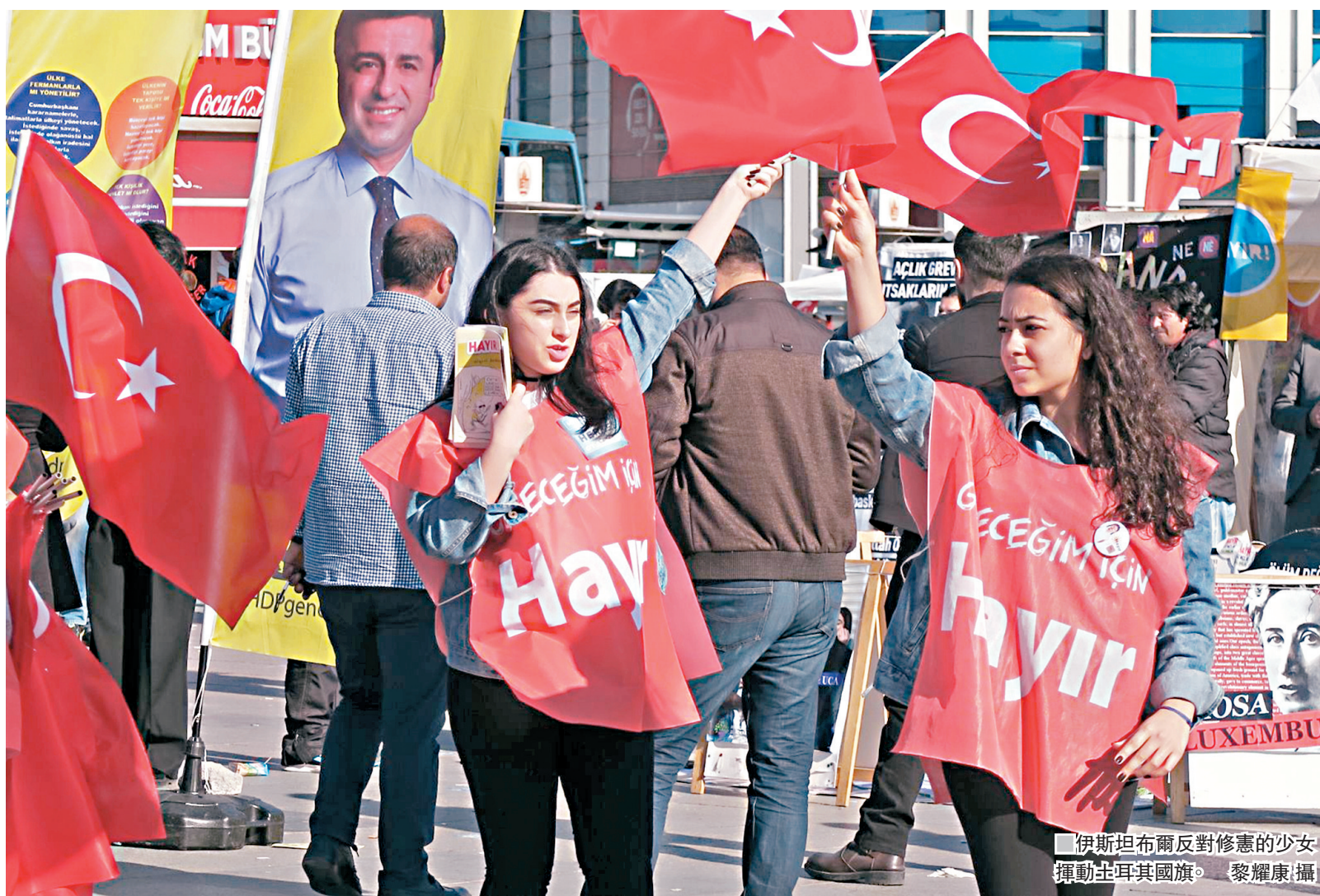
伊斯坦布爾反對修憲的少女揮動土耳其國旗。

土耳其有投票資格的選民約5,800萬人，伊斯坦布爾市面多處有支持或反對修憲的海報及橫額，在人流較多的碼頭、地鐵站及商場外，政黨派發宣傳單張，部分街站播放音樂，義工載歌載舞、場面熱鬧。