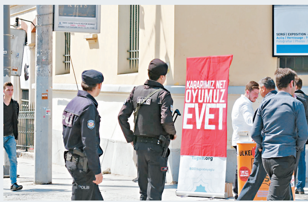
持槍警員於支持修憲的街站旁停留。