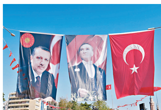
左起：埃爾多安、凱末爾及土耳其國旗。

權力使人腐化，埃爾多安近年執政有跡象趨向專制，他關閉多間傳媒機構，加強審查互聯網，令人憂慮該國逐漸收緊公民自由。然而，去年流產政變期間，全國國民不論支持或反對埃爾多安，均走上街頭對抗發動政變的軍人，無形中為埃爾多安累積更多政治資本，當局更大舉搜捕異己，大批反對派人士、律師及記者身陷囹圄。