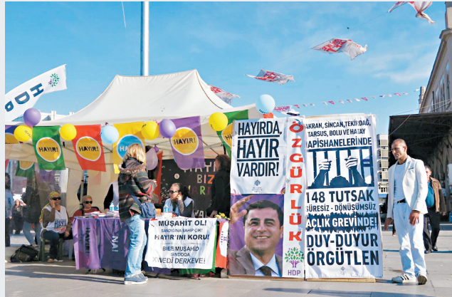
HDP於碼頭外開設街站反對修憲。