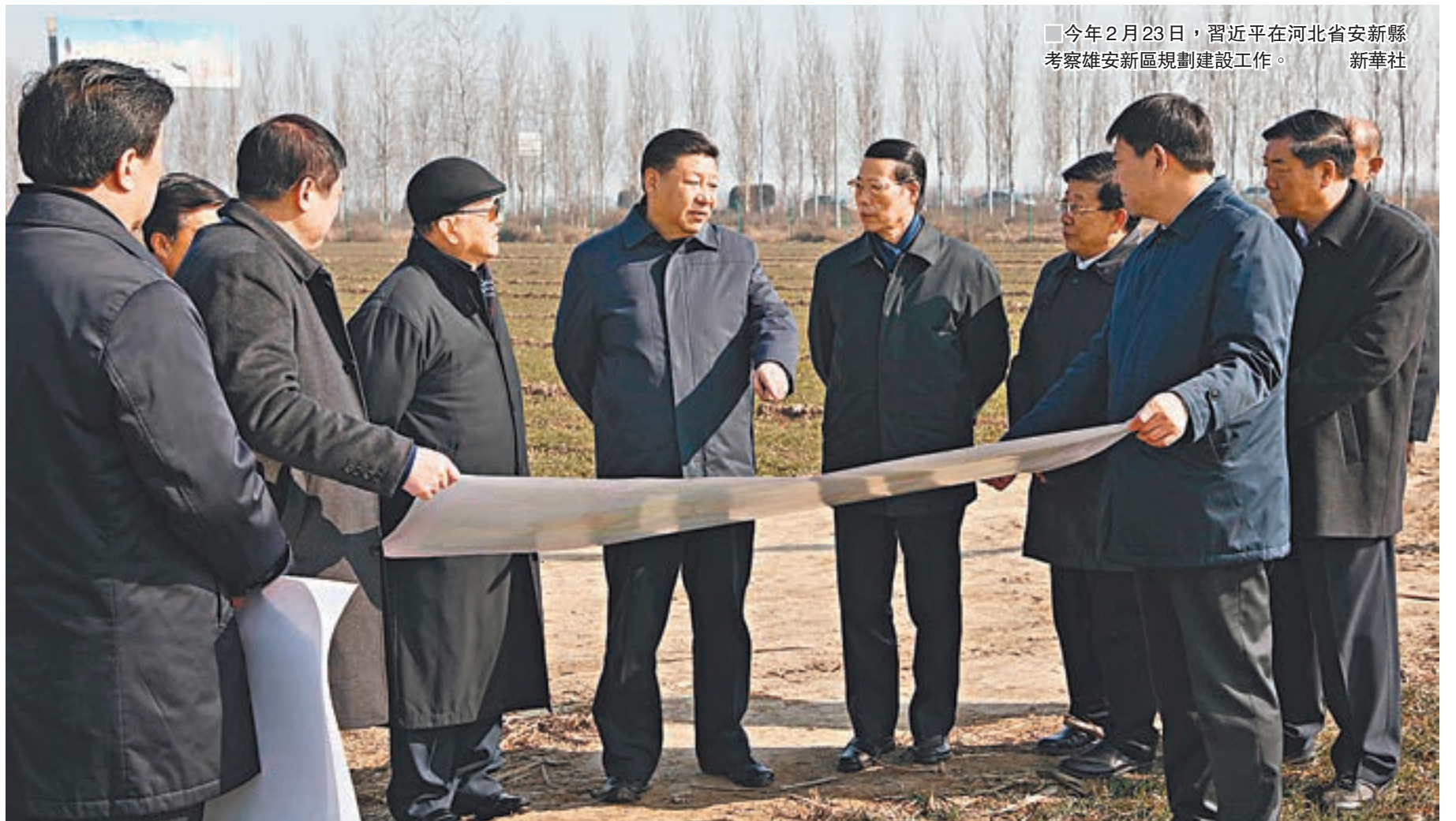
今年2月23日，習近平在河北省安新縣考察雄安新區規劃建設工作。

針對央企如何參與到雄安新區建設的問題，國資委總會計師沈瑩表示，央企要帶頭執行國家重要戰略部署，按照中央發展規劃，積極進行產業對接，在雄安新區建設中發揮重要作用。她強調，未來國資委將做好中央企業的引導、指導工作，讓中央企業在落實好國家的重大戰略部署中發揮應有的作用。