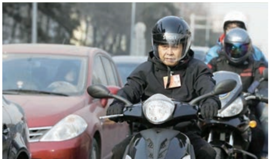
左宗申委員騎摩托車參會。

對於左宗申提及的「製造業崗位因工資漲幅度不大導致的產業工人流失」問題，全國政協委員、中華全國總工會黨組成員李守鎮今年在全國兩會政協第二次全體會議上指出，「工匠精神」雖然成為高頻熱詞，但是社會上重學歷輕技能的觀念並未得到根本扭轉。李守鎮提及，縱觀世界，日本高級技工佔比40%，德國則達到50%，在內地這一比例僅為5%左右，高級技工缺口近1,000萬人。 「職業教育投入不足、質量不高、吸引力不強等問題依然突出。」李守鎮亦強調，要營造「崇尚一技之長、不唯學歷憑能力」的良好氛圍，讓「金藍領」成為實現製造強國目標的堅實根基和有力支撐。