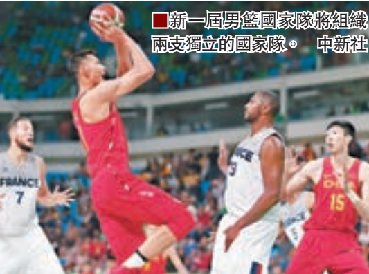
新一屆男籃國家隊將組織兩支獨立的國家隊。

中國籃協昨日啟動東京奧運周期中國男籃主帥選拔，將選拔組建兩支獨立的教練員團隊分別執教兩支國家隊同時集訓。當日，中國籃協官網公佈新周期中國男籃主帥選拔方案及中國男籃組建模式。方案明確，將在同等保障條件下，組織兩支獨立的國家隊同時集訓，兩支隊伍的運動員在2017年、2018年「原則上不交叉、不流動」，分別承擔國際大賽任務。自2019年起合併為一支國家隊備戰世界盃及2020年東京奧運會。兩支國家隊由兩個獨立的教練員團隊分別執教。教練組均以中方為主、外方為輔，實行隊委會領導下的主教練負責制。