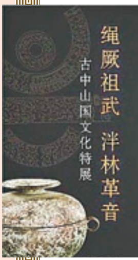
繩厥祖武 泮林革音 古中山國文化特展

中山國所處的春秋戰國時代諸侯紛爭，戰爭頻仍，客觀上加速了民族文化的交流和融合。自桓公都靈壽以來，中山國在保留傳統遊牧文化同時，開敞了積極吸納中原文明的進程：崇尚儒學，實踐法學，效仿華夏諸國建立政治制度；大量使用鐵質農具；製陶、琢玉、冶煉鑄造等手工業工藝高超，以「多美物」著稱；交通比較發達，使用較先進的計量器具，並鑄有本國貨幣，商業相當繁榮，異地的物產匯於中山。以上諸多方面體現了中山國對華夏文化的嚮往，這些也催生了中原文化在中山國大放異彩。