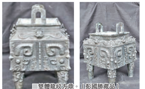
雙體龍紋方鼎。(彭國勝藏品)

今次介紹此(雙體龍紋方鼎)為商代晚期方鼎工藝非凡，造形奇特。鼎高30公分，闊20公分，口闊15公分，底有銘文8個字。鼎上方四邊各有合體龍一條，龍身有幾何三角紋，四個角邊飾有浮雕獸面紋，中有扉棱，下方在扉棱二邊，四面各有虎紋一對，雷文為地，方邊平底。四柱足裝飾浮雕獸面紋，鐫厲威嚴，富有神秘氣氛。(該作曾於2016年會議展覽中心貿易發展局主辦書展之「文藝廊」參展) 文：青銅緣