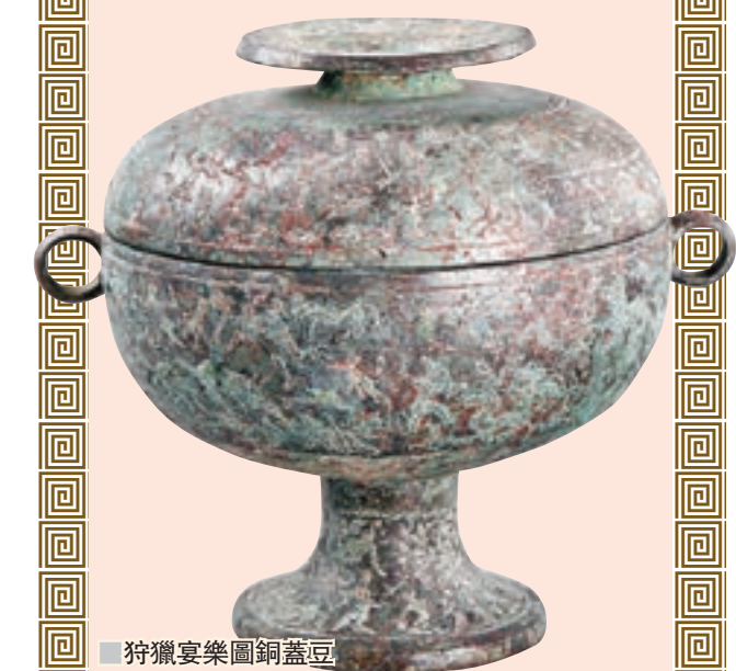
狩獵宴樂圖銅蓋豆