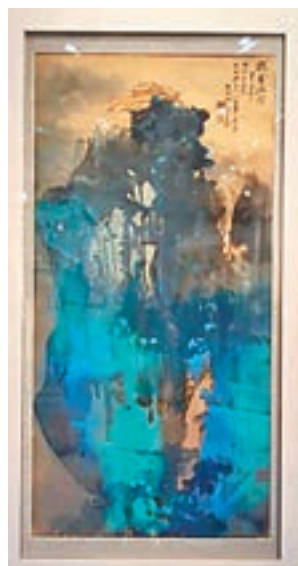
張大千1967年作《瀟霍瑞靄》鏡框潑墨潑彩金箋 尺寸128.2x63.5cm 成交價HKD 31,037,500