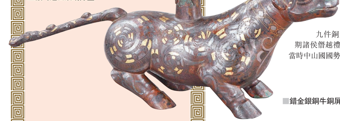
錯金銀銅牛銅屏座