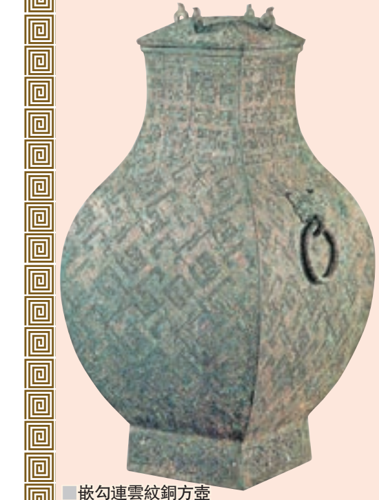
嵌勾連雲紋銅方壺