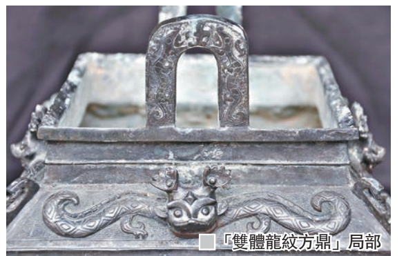
「雙體龍紋方鼎」局部

青銅鼎是在新石器時代陶鼎的基礎上發展而成的。鼎兼有烹煮和盛食兩種功能，原為煮肉食的烹飪器，相當於現在的鍋，用來烹煮或盛放魚或肉等食材。從夏晚期至兩漢時期，鼎成為貴族進行宴客和祭祀時使用的重要禮器。商周有嚴格的用鼎制度，因鼎在當時也包含着權力象徵。戰國直至兩漢，青銅鼎也被用作量器。宋至明清時期，青銅鼎多作為祭器使用。