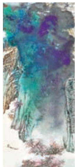
去年張大千1982年潑彩巨作《桃源圖》以2億7068萬港元成交價，被藏家劉益謙競得。

對穩定的市場基礎，即使如今非經典之作的張大千價格下跌近半，但是對於不同等級的精品，藏家還是能給出十分客觀的價格。「從整體看，精品的價格比較穩。」華藝國際副總裁林宇清指出，一般應酬的作品隨時間出現調整，而且還會繼續往下調。他發現，「普品」有不同的調整幅度，如果是5年或以上在市場未現身作品，幅度稍微低一點，而市場常見的作品調整幅度較大。文：張夢薇