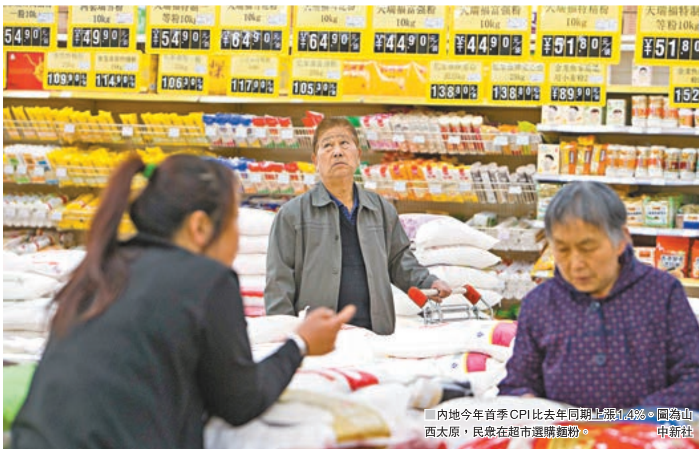
內地今年首季CPI比去年同期上漲1.4%。圖為山西太原,民眾在超市選購麵粉。

中金宏觀報告則指出,3月份CPI仍保持低位,主因是食品價格仍在下降通道,而非食品價格季節性溫和上漲,同時3月PPI生活資料出廠價格環比在零,說明PPI上漲向非食品傳導,依然並不順暢。往後看,食品價格仍較弱,且豬肉價格仍有下降空間,非食品較為溫和,預計二季度CPI在目前不到1%的水平小幅回升,4月在1.1%附近。至於貨幣政策,由於CPI持續低位,貨幣政策難以採用傳統的加息等手段進行調控。