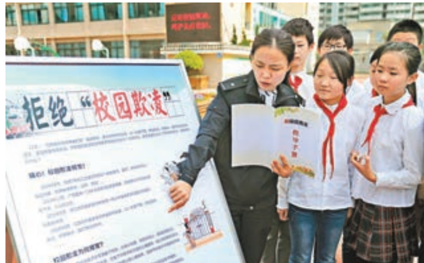
民警走進校園,向學生們普及反校園欺凌防範和自救知識。資料圖片

中國郵政集團郵票發行部門相關負責人昨日亦證實,淘寶等電商目前銷售的「國產航母下水首日封」並非該集團發行,現階段不方便透露相關紀念品的設計發行情況。公開資料顯示,海軍集郵研究會於2008年在山東青島成立,海軍北海艦隊原副司令員朱鴻禧中將被聘為名譽會長,海軍航空兵戰鬥英雄高翔被聘為形象大使,現有會員700多人,主要從事海軍紀念封等郵票的收集和設計,同時注重弘揚海軍和海洋文化。