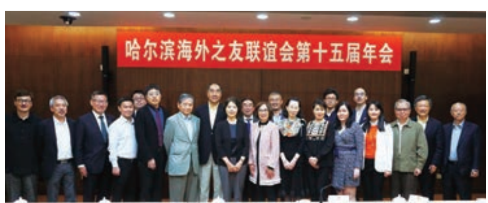
哈爾濱海外之友聯誼會在深圳紫荊山莊召開第十五屆年會

4月8日，哈爾濱海外之友聯誼會在深圳紫荊山莊召開第十五屆年會，哈爾濱市政協副主席楊曉萍親臨主持會議，香港中聯辦派員列席參與，香港委員及澳門委員以及特邀嘉賓合共數十人出席，彼此認真討論，親切交流。