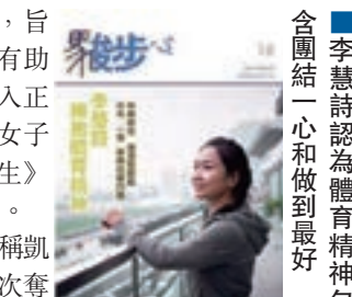
李慧詩認為體育精神包圍結一心和做到最好。

香港賽馬會支持出版的《駿步人生》，旨在透過報道社會上的善行美事，並介紹有助解決問題的方法和渠道，為香港社會注入正能量。近日出版的一期刊登了本港首位女子單車比賽世界冠軍李慧詩接受《駿步人生》專訪的文章，分享其「女車神」體育精神。