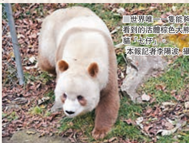
世界唯一一隻能夠看到的活體棕色大熊貓「七仔」。

據介紹，1985年3月，佛坪縣岳壩鄉農民呂國友在大古坪保護站轄區內發現了一隻棕白相間的熊貓，這便是世界上第一隻被發現的棕色大熊貓「丹丹」。隨後，重病的「丹丹」在專家的全力救助下痊癒，並於1989年和佛坪同鄉