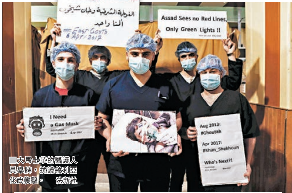
大馬士革的醫護人員舉牌，抗議敘利亞化武襲擊。法新社