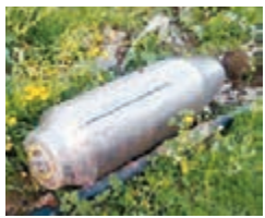
敘利亞發現美軍使用的導彈殘骸。

奧巴馬當年擔心美國會捲入敘內戰核心，危害美軍的性命，最終選擇了與俄方合作，銷毀敘政府的化武，而不是攻擊政府軍。雖然不少國防專家和軍方高層均對此不以為然，但奧巴馬直到卸任前，仍然對當年的決定感到「驕傲」。事隔數年，敘利亞局勢較之前更複雜，美軍插手令衝突擴大的風險更高，其中最明顯的轉變是部署在敘利亞的俄軍顯著增加。就算美軍的攻擊目標只是敘政府，但因為俄敘的戰力混在一起，隨時會誤傷俄軍。