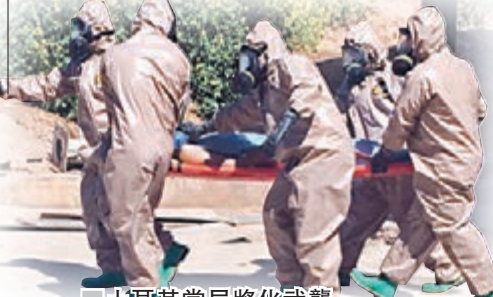
土耳其當局將化武襲擊受害者送院。

亞洲股市昨日下午，MSCI亞太指數扭轉早段升勢，倒跌0.2%，石油股逆市造好，日本Inpex急升4%。新興市場貨幣偏軟，韓國一度下跌0.6%，跌至3月中以來低位，其後跌幅收窄。土耳其里拉跌0.3%，俄羅斯盧布兌美元則跌約1%。資金湧入日圓，美債及貴金屬避險，日圓兌美元匯價一度升0.6%，每日日圓兌港元最高見7.0549，金價升1%至每盎司1,266.2美元，銀價亦升1%，10年期美債息則最低見1.29厘的4個月低位。歐洲股市早段個別發展，英國富時100指數報7,314點，升11點；法國CAC指數報5,116點，跌5點；德國DAX指數報12,180點，跌50點。