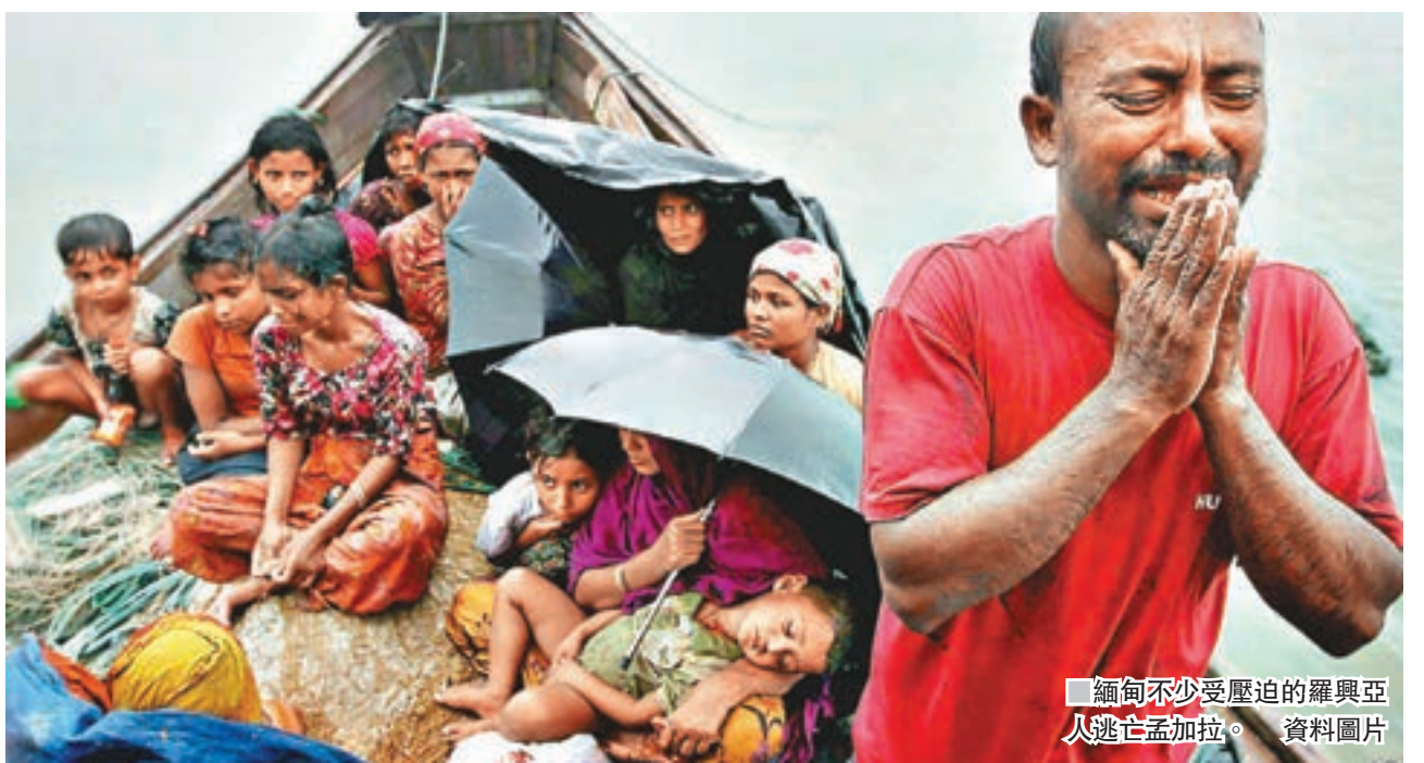
緬甸不少受壓迫的羅興亞人逃亡孟加拉。資料圖片