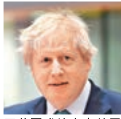
英國或於未來數周落實約翰遜訪俄。

俄羅斯吞併克里米亞後，英國聯同其他西方國家共同制裁俄國，導致兩國關係緊張。不過《獨立報》報道，鑑於美國特朗普政府有意改善對俄關係，加上俄國在中東及北非影響力日增，英國在反恐、敘利亞及利比亞局勢等方面，都必須借助俄國。為此，英國政府決定暗