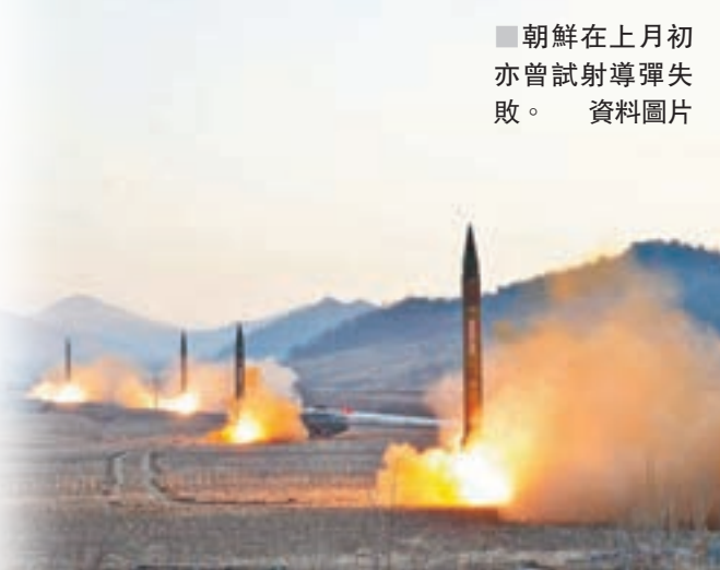
朝鮮在上月初亦曾試射導彈失敗。資料圖片