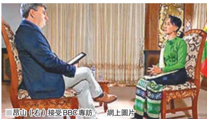
昂山(右)接受BBC專訪。

昨日是緬甸國務資政昂山素姬就任一周年，她日前罕有地接受海外媒體專訪，對於緬甸信奉伊斯蘭教的少數民族羅興亞人在過去一年間，持續遭到軍方血腥鎮壓，造成難民潮，身為諾貝爾和平獎得主昂山承認羅興亞人聚居的若開邦的確存在問題，但否認他們遭到「種族清洗」，認為西方媒體的用字「太強烈」。被問到外界將她比喻為德蘭修女或印度聖雄甘地是否合適，昂山則坦言自己只是「一介政客」(just a politician)，似乎不欲被寄予太多期望。