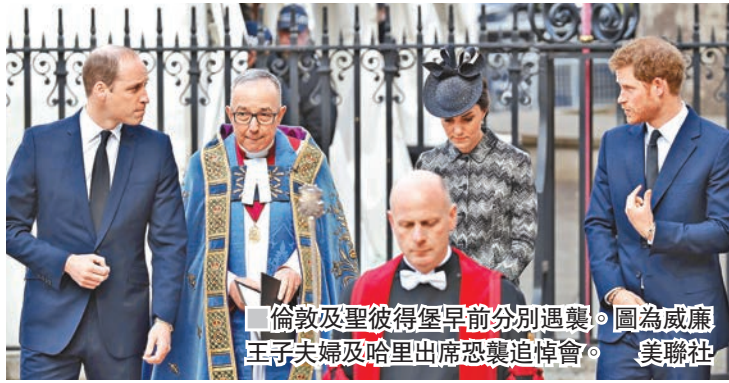
倫敦及聖彼得堡早前分別遇襲。圖為威廉王子夫婦及哈里出席恐襲追悼會。