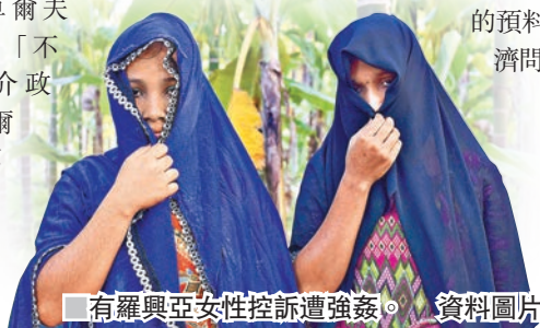
有羅興亞女性控訴遭強姦。資料圖片