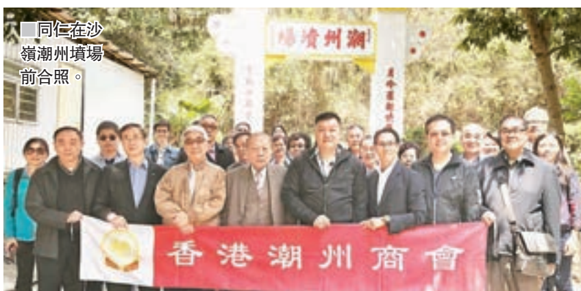
同仁在沙嶺潮州墳場前合照。