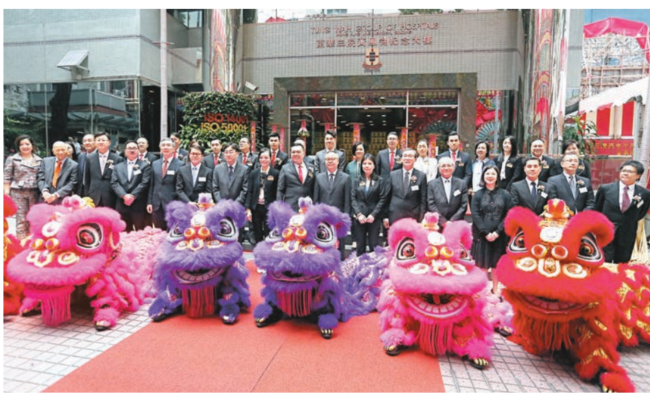
東華三院丙申年及丁酉年董事局交代就職典禮,賓主合照。

他讚揚,該院是特區政府的重要合作夥伴,如去年的「極光飄雪嘉年華」、拓展天水圍天秀墟等,均成功加強社區的凝聚