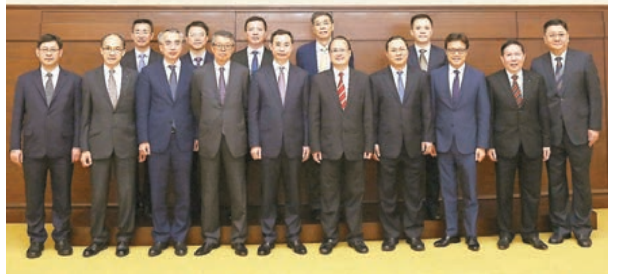
六間商會首長與溫國輝市長(左五)及代表團交流。