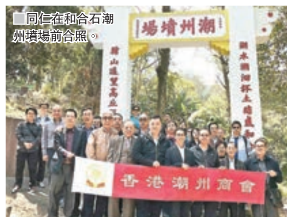
同仁在合石潮州墳場前合照。