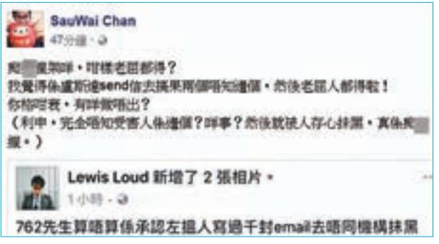
陳秀慧爆粗回擊。