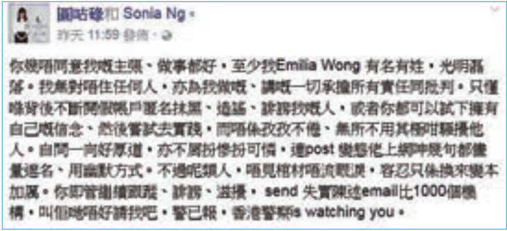
兩「獨女」於fb上話有人用電郵轟炸校方。而與兩人關係友好、與「熱狗」素有積怨的盧斯達就將矛頭指向「熱狗」。