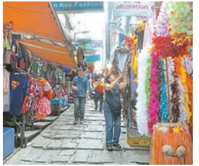
有店販指受網絡購物影響，今年人流減少。

香港文匯報訊（記者 文森）在七人欖球賽期間，不少入場人士會扮鬼扮馬，戴上頭飾、面具，甚至穿上一身啦啦隊服飾為心儀隊伍打氣。本報記者昨日到集中出售服飾、面具的中環石板街視察，發現有不少外國遊客到場選購產品。有商戶表示，比賽對生意有一定幫助，料今年生意額升逾3倍。不過，有商戶指受網絡購物影響，今年人流減少，生意額按年下跌10%至20%。