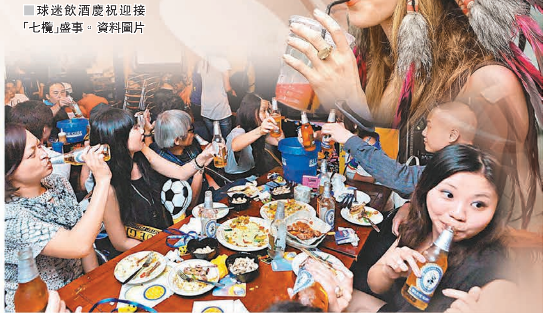
女球迷身穿印第安服飾，秀色可餐。資料圖片