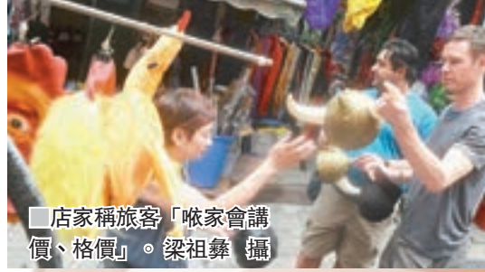
店家稱旅客「啱家會講價、格價」。