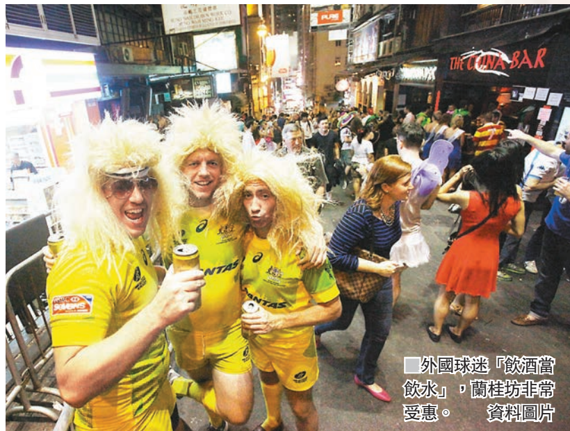
外國球迷「飲酒當飲水」，蘭桂坊非常受惠。資料圖片

香港文匯報訊（記者 文森）一年一度的「香港國際七人欖球賽」今日正式殺入香港大球場！「七欖」每年比賽均吸引大批海外旅客來港欣賞比賽之餘，更帶動了香港旅遊業及零售業發展。有酒吧業界昨日指，是次比賽定能帶動酒吧業生意，有外國旅客會訂房暢飲，甚至有酒吧在七欖賽平日設最低消費，預料生意額較平日上升30%至50%。不過，酒店業界則透露，由於環球經濟不景、港元強勢影響，估計比賽期間酒店入住率按年下跌10%，接近90%。