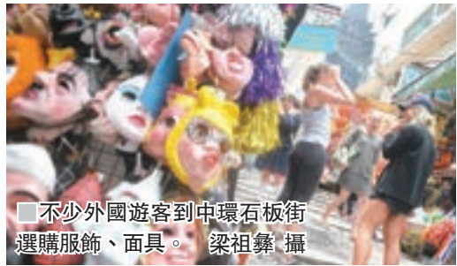
不少外國遊客到中環石板街選購服飾、面具。