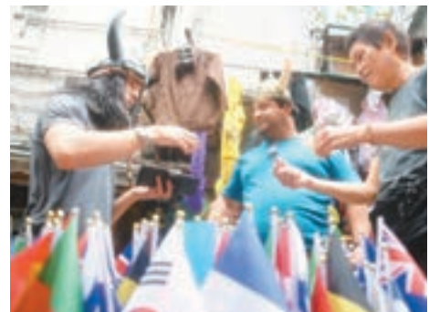
不少外國遊客到中環石板街選購服飾、面具。

位於石板街，出售服飾、面具及各國國旗等店舖負責人Carol昨日表示，店舖購入新入美國總統特朗普頭套、電影《美女與野獸》中「美女」的服飾等，又指七人欖球賽猶如大節日，比賽前是高峰期，亦要晚一點