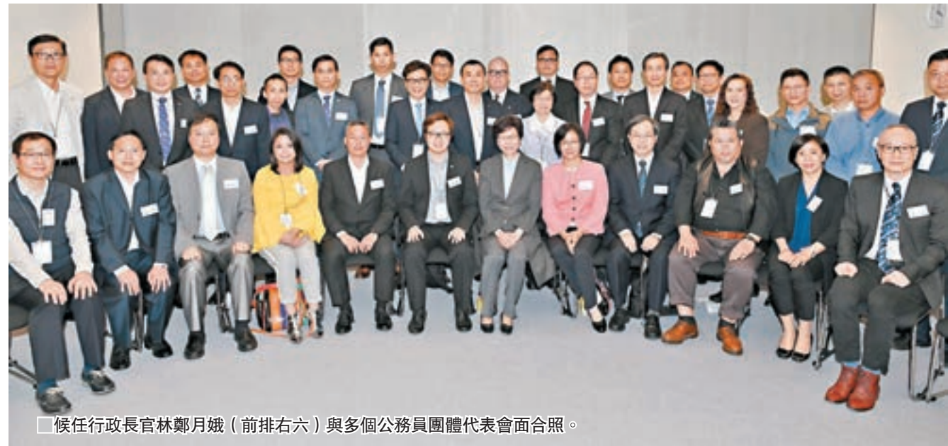
候任行政長官林鄭月娥(前排右六)與多個公務員團體代表會面合照。

她續說，上任後會鼓勵部門首長檢視行政程序，在不影響公眾利益的情況下「簡政放權」；訂立清晰的工作目標和行事指引，為前線公務員同事減壓等。