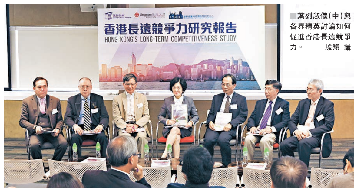
葉劉淑儀(中)與各界精英討論如何促進香港長遠競爭力。

香港文匯報訊(記者 殷翔)香港競爭力跑輸滬、深、星、韓等周邊競爭對手，情況令人擔憂。一項為期兩年的「香港長遠競爭力研究」昨日公佈研究成果，指問題根源在於政治內耗，若香港要克服政治內耗提升長遠競爭力，須由根源緩解各項深層矛盾，包括降低貧富懸殊、突破土地和人力嚴重短缺樽頸、改革教育培養年輕人謙卑的心等，具體建議包括改革教育，及在文化及採購政策上「本地優先」，扶持創新產業，為青年增加上流機會；將利得稅稅率減半，促進商企活力；向市民回贈起碼生活消費中繳交的商品稅和服務稅等。