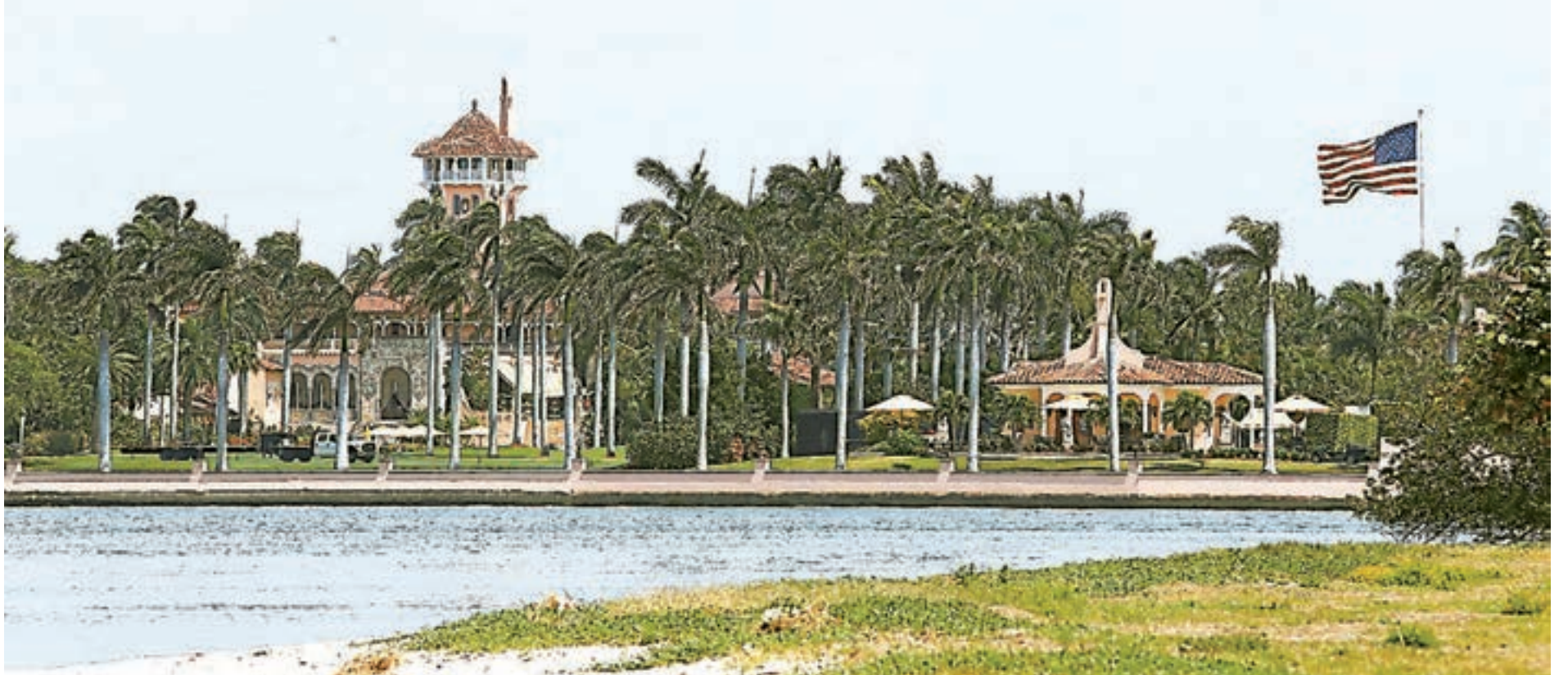
■ 中美元首會晤於當地時間6日到7日在美國佛羅里達州海湖莊園舉行。

對於兩國間貿易中現實存在的摩擦，馬林認為，解決摩擦最好的方法就是始終保持卓有成效的對話，不斷傾聽對方的想法，以開放和包容的心態來解決問題。