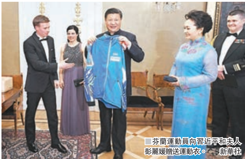
■ 芬蘭運動員向習近平和夫人彭麗媛贈送運動衣。

尼尼斯托表示，很高興同習近平主席共同會見兩國冰雪運動員代表。芬蘭是冬季運動普及率較高的國家，在冬季項目和比賽籌備方面頗具成功經驗。芬方願同中方分享經驗，深化冬季運動領域合作。芬方支持中國成功舉辦2022年北京冬奧會。