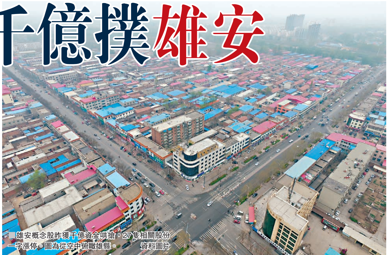
雄安概念股昨獲千億資金哄搶，27隻相關股份一字漲停。圖為從空中俯瞰雄縣。

其一是「京津冀」本地房企或在該區域有土地儲備的上市公司直接受益，如京漢股份、廊坊發展、華夏幸福、榮盛發展等；其二從此前的行政區劃上看，雄縣、容城、安新都隸屬於河北省保定市，保定地區上市公司受到的利好程度明顯，依次推薦寶碩股份、保變電氣、巨力索具、中國動力、長城汽車、凌雲股份、樂凱新材、樂凱膠片、四通新材、華訊方舟等。其三，京津冀地區中涉及「鋼鐵、水泥、工程機械、港口、高速公路」等行業的上市公司亦有望受益，推薦冀東水泥、金隅股份、河鋼股份、新興鑄管、首鋼股份、河北宣工、唐山港、天業通聯、三一重工、天津港、華北高速等；其四是在雄安新區有相關業務合作的上市公司，依次推薦維鷹農牧、長青集團、先河環保等。