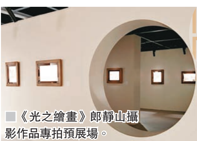
《光之繪畫》郎靜山攝影作品專拍預展場。

走下夜拍的紙上大師，價格親和，又別有韻味，年輕藏家將其納入，拍場中吹過一陣清新風。延續夜拍，兩位上世紀巴黎的異鄉客，日本畫家藤田嗣治，與華人畫家常玉，繼續展開紙上的對談，寫出日場亮點。5件來自歐洲藏家的藤田嗣治紙上作品與4件常玉紙本皆全部成交，其中藤田嗣治3件作品遠超估價落槌，其40年代後作品，水彩《少女坐像》，鋼筆勾出的蜿蜒線條讓寫實的畫面極具東方韻味，該作以60萬港幣成交。常玉罕見的雙面水彩、水墨畫作《男子肖像》在畫作內容意義的加持下，更以97.5萬的價格成交，拍前估價為40萬港幣。同場丁衍庸60年代初紅色木板油彩《裸女J》，來自比利時漢學家李克曼（Pierre Ryckman）舊藏，丁氏油畫量少加上名人舊藏，此前該作估價為70萬港幣，現場以兩倍價格的170萬落槌，接續四件人物為主丁公紙本彩墨，包含一件雙面鏡心的彩墨《霸王別姬》，亦拍出不錯的丁公行情。