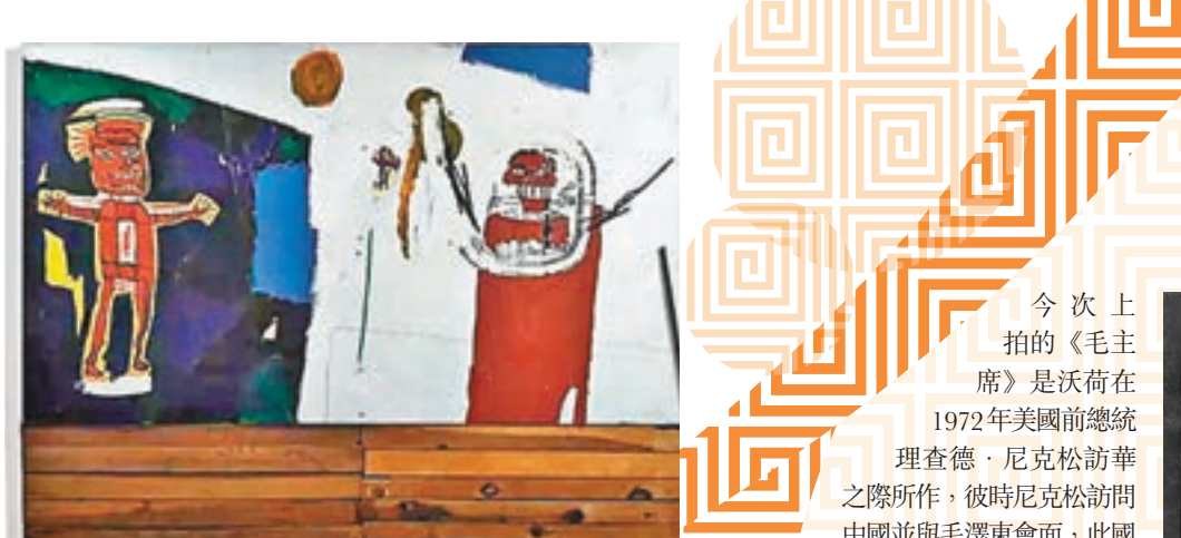
巴斯奎特《致水神》成交價：4,228.75萬港元。