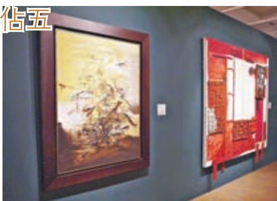
現代藝術前5的另外2席上，是被劃入現代部分的王懷慶和現代華人藝術先驅林風眠。今次夜場出現的最大尺幅的林風眠油畫經典《豐收的早晨》，以稍低於估價的2,000萬槌價順利成交。接續其後上拍的，是林風眠國立藝專時資優生吳冠中的兩件創作，開始於70年代的

夜場由5件橫跨老老各個風格時期的趙無極油畫開啟，這5件別具品味的趙老油畫悉數成交，位於4號位置的趙無極60年代黃色畫作，代表趙老巔峰時期創作氣質，該作最終於3,400萬處落槌，比拍前高估價多了600萬。另外1件克利時期創作《月滿千帆》，以比估價高出一口的2,600萬落槌，此作上次現身於2009年佳士得春拍以1,410萬成交。除此兩作，其餘3件槌價基本都落在估價區間中，不過夜場成交前10，趙老一人穩坐其三，呈現出趙無極的穩健與市場的冷靜心理。