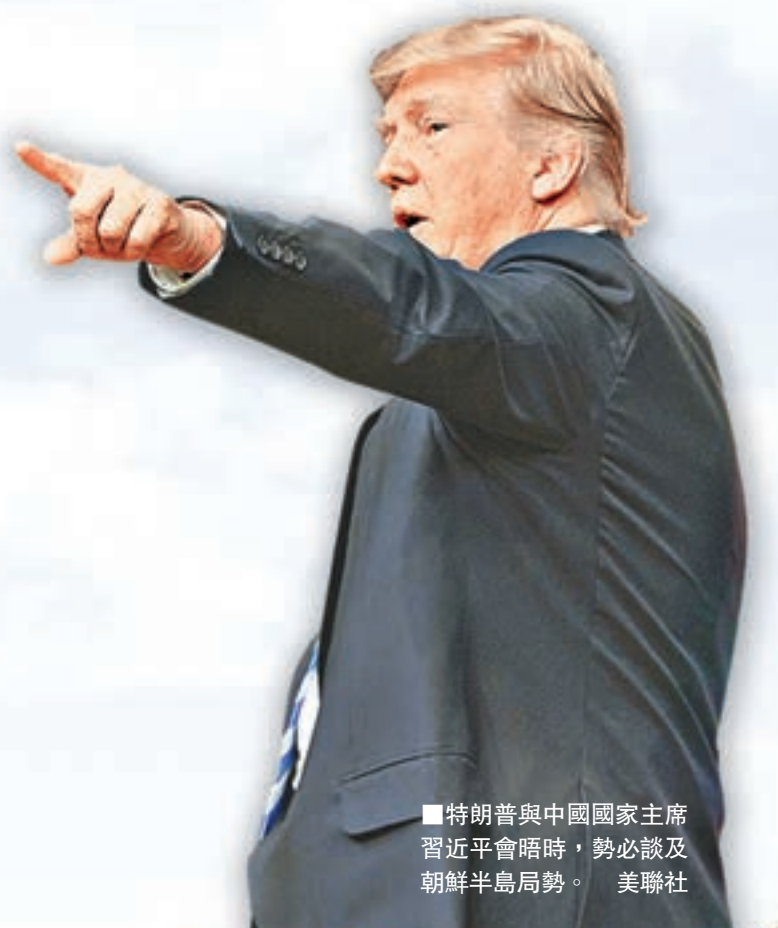
■特朗普與中國國家主席習近平會晤時，勢必談及朝鮮半島局勢。