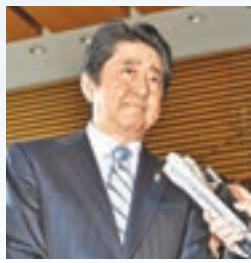
■朝鮮試射導彈後，日本首相安倍晉三被傳媒追訪。

朝鮮昨日向日本海發射彈道導彈，在已故領袖金日成誕辰105周年等重要政治日程前夕，再度顯示出大力推進導彈開發的姿態。在中美元首即將會面商討對朝策略前，朝鮮此舉可能旨在表現出不屈服於國際壓力的態度，以作出牽制。