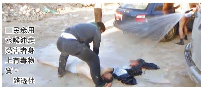
■民眾用水喉沖走受害者身上有毒物質。