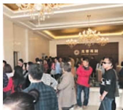
■保定市徐水區一售樓處，大量購房者等候樓市開盤。

這位官員還提醒說：「私下達成的交易可能面臨兩個顯性風險：一是新區大規劃還沒有出台，私下交易的房產很可能成為新區規劃的綠地，投資投資者的增值希望很可能落空；二是私下交易視為非法，政府拒絕房地產登記證。將來補償，政府認證不認人，購房者不可能拿到預期的增值。」