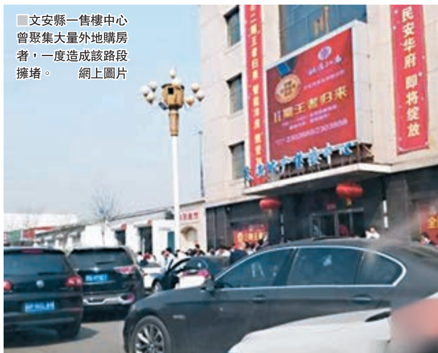
■文安縣一售樓中心曾聚集大量外地購房者，一度造成該路段擁堵。

據了解，4月4日起，當地的房產類公證已經全部暫停。當地的工作人員表示，做了公證，能順利過戶，房子才算是你的。而安新縣已經凍結過戶，即使公證好了，也過不了戶。