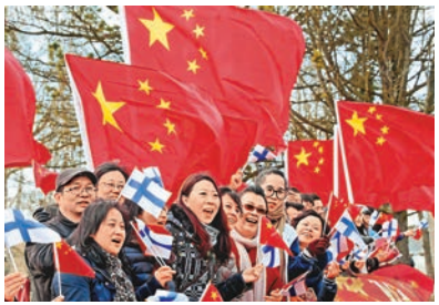
芬蘭華人華僑、留學生等揮舞中芬兩國國旗歡迎習近平到訪。

會談後，兩國元首共同見證了創新、司法、大熊貓合作研究等領域雙邊合作文件的簽署，還共同會見了記者。