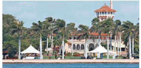
中美元首將於4月6日至7日在美國佛羅里達州海湖莊園舉行會晤。

一部分對話機制，同時調整、精簡一部分對話機制。他還表示，兩國在公共衛生、打擊跨國犯罪、人文交流、經濟等領域仍有很大的合作空間。他說，此次會晤將會發表一份積極的聲明。