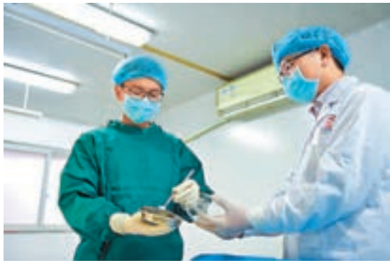
四川藍光英諾公司實驗人員正在檢驗3D打印血管。

成都將積極推進「蓉歐+」陸港產業園建設,引進歐洲端及蓉歐快鐵沿線國家地區優勢產業和技術研發企業。此外,成都還將在人才引進提升、土地供應保障、市場體系建設、金融服務支持、信息技術支撐、企業培育扶持、產城融合發展等方面抓好頂層設計和政策引導,構建務實高效的產業生態體