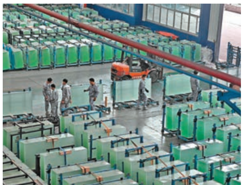
圖為福建福清市一家玻璃企業員工在生產車間作業。

產業配置上,今年以來經濟周期類股相較防禦性類股折讓幅度雖已明顯縮減,但仍呈現深度折讓狀