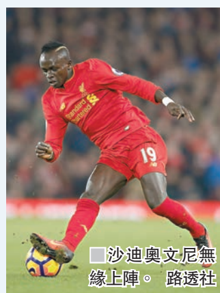
沙迪奧文尼無緣上陣。

近期保持不敗的「紅軍」利物浦明晨將主場對般尼茅夫，對今季「鋤強扶弱」的利物浦來說，會不會在主場送出這3分？(LeSports HK 應用程式、now626台周四3:00a.m.直播)