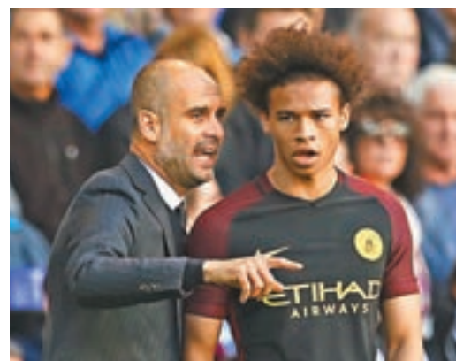
曼車鋒將利萊辛尼(右)。

談到對壘曼城，干地說：「我們知道曼城在賽季開局時是奔着冠軍去的，他們擁有一個非常強大的