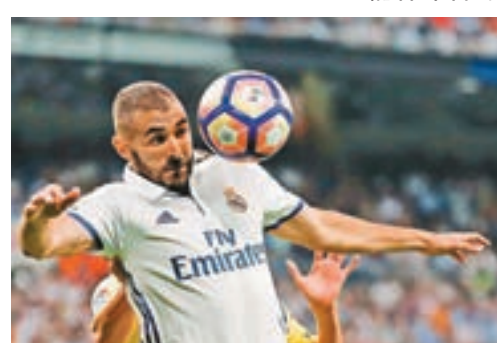
皇馬射手實施馬。

同日，皇馬作客中下游球隊雷加利斯，預料能全取3分，鞏固積分榜優勢(now632台周四3:30a.m.直播)。雙方目前聯賽排名相差甚遠，可見彼此整體實力懸殊，兼且皇馬近期豪取各項賽事五連勝，勢頭十分勇猛，其中前鋒實施馬在近4場勝仗中攻入4球，皇馬此番揮軍取勝難度不大。 ■記者 梁啟剛