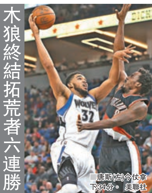
唐斯(左)今仗拿下34分。

NBA常規賽昨日進行了一場較量。唐斯拿下34分和12個籃板，率領明尼蘇達木狼以110:109險勝波特蘭拓荒者，終結了後者的六連勝。