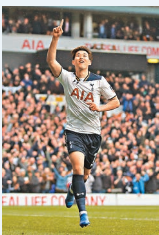
熱刺主將孫興民。

爭奪球隊首個英超冠軍錦標的北倫敦豪強熱刺，把握車路士失分的機會而成功縮小了差距，再次重燃爭冠希望。明晨聯賽，熱刺將客戰「天鵝」史雲斯，誓再接再厲全取3分。(LeSports HK 應用程式、now623台周四2:45a.m.直播)