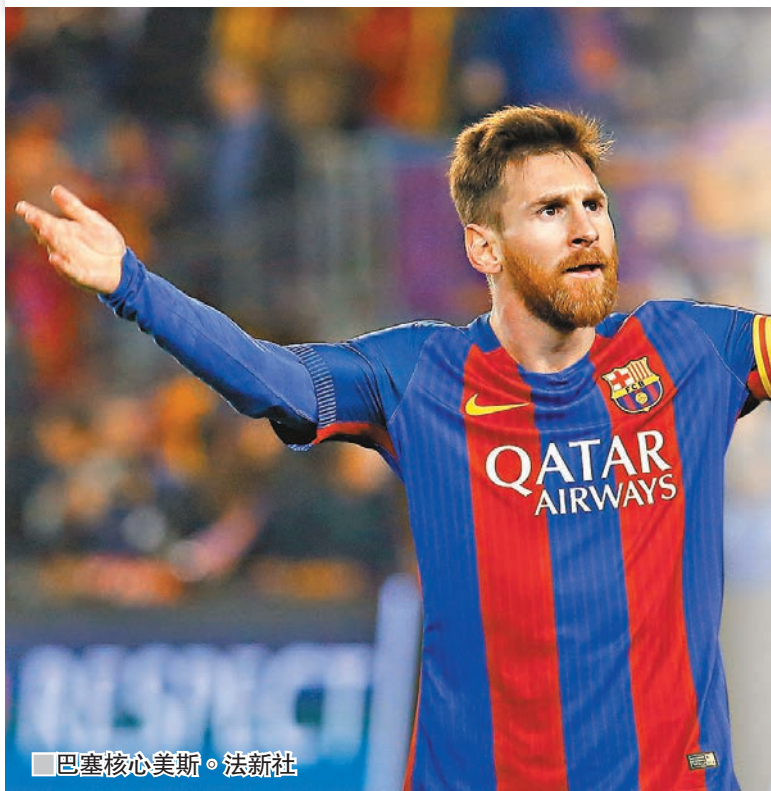
巴塞核心美斯。