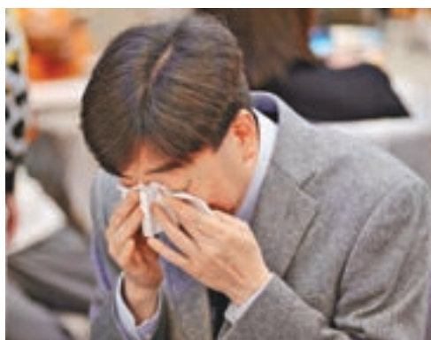
寫作時要注意用詞不能太過火，流淚不是問題，但用「淚如雨下」、「眼淚如缺堤的洪水」之類，就要考慮清楚。

第六點，文章亮點，畫龍點睛。首尾呼應，是其中一個簡單的技巧。首段能夠吸引讀者，製造懸念，結段給予人餘韻未盡的感覺。記敘文的結尾，不少同學或因興之所至，用一兩句或一句說話結尾，沒有刻意經營。其實重複首段字眼，即能做到首尾呼應，確保文章結構嚴謹。