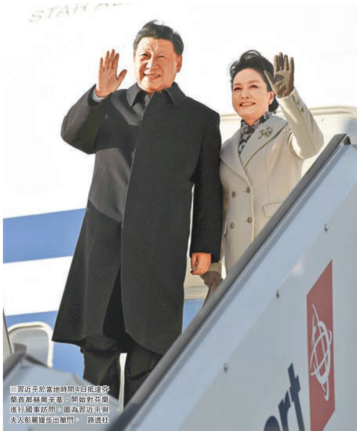
■習近平於當地時間4日抵達芬蘭首都赫爾辛基，開始對芬蘭進行國事訪問。圖為習近平與夫人彭麗媛步出艙門。

芬蘭對於中國的「一帶一路」倡議一直持非常積極的態度。尼尼斯托表示，「一帶一路」意味着聯通。芬蘭認為，各國只有更緊密地聯通，彼此之間才能更好地理解。「一帶一路」也將使歐盟獲益，促使歐盟內部以及與外部的聯繫更加密切，帶動歐盟經貿和投資的增長。