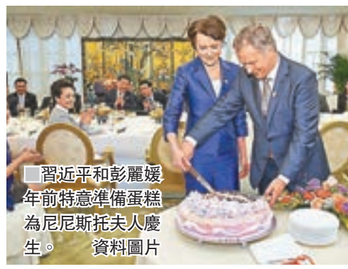
■習近平和彭麗媛年前特意準備蛋糕為尼尼斯托夫人慶生。

尼尼斯托曾多次訪問中國。在採訪結束時，記者向尼尼斯托贈送了太極柔力球拍，尼尼斯托興奮地回憶起十多年前訪問中國時在北京的公園裡與退休老人一起娛樂的情景。他表示，中國普通百姓的生活情景給他留下了美好而深刻的印象。