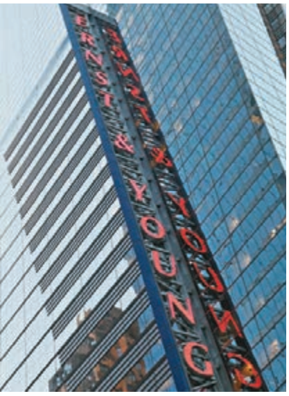
2010年12月20日,《華爾街日報》報導,美國檢察官據報準備向四大會計師事務所之一安永(Ernst & Young)提出民事起訴,指它作為已倒閉投資銀行雷曼兄弟的核數師,批准雷曼「造數」誤導投資者。資料圖片

十年前,也就是2007年,在那個時候,許多人可能都還才剛剛踏進這個產業,但到了十年後的現在,當時曾經歷過金融風暴的人,到了現在,印象可能還是相當的深刻。今天我們就是要回顧當時,看我們在那次的痛苦經驗中,可以從中學到什麼事情。 首先,我們學會了,清楚劃分問題的徵兆,與問題的根本所在,是極為重要的。 在2007年8月,銀行一直都極為堅持,它們所面對的是流動性問題,而不是償債能力出了問題,所以只要市場恢復流通性,所有的事情都不會是個問題。 但是,銀行的欠缺流動性,只是個徵兆,而非問題的本身。金融市場對銀行的資金來源與放款活動產生疑慮,這本身並沒有錯。許多銀行認為,除了專注在滿足短期資金的需求之外,它們基本上可以不用做任何的改變,就可以從2007年金融風暴的後續影響中,再重新地站起來。