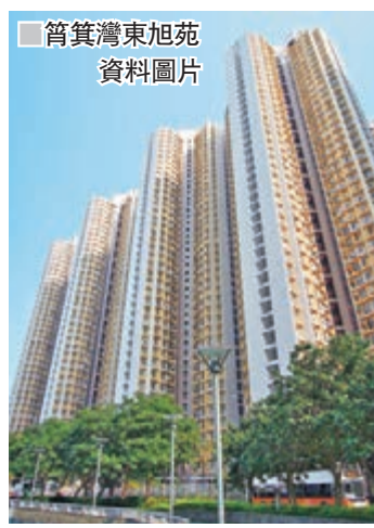
筲箕灣東旭苑資料圖片

房委會資料亦顯示,筲箕灣愛蝶灣低層戶,實用面積592方呎,於綠表市場以638萬元成交,折合呎價10,777元,創屋苑成交呎價新高。