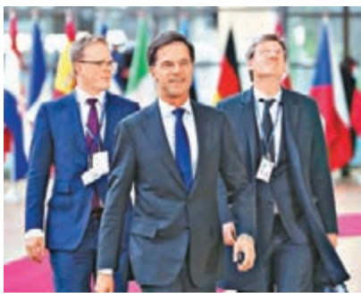
今年三月荷蘭大選由原首相呂特(中)勝出,消除了市場對荷蘭極右民粹升溫、要求脫歐的壓力。

政治不確定性仍將影響市場情緒,但不至帶來極大風險。 法德經濟復甦前景看好 政治紛擾不影響歐元區經濟復甦,基本增長步調不變,企業前景持續看俏。 通脹升溫、經濟回暖,2月份通脹增