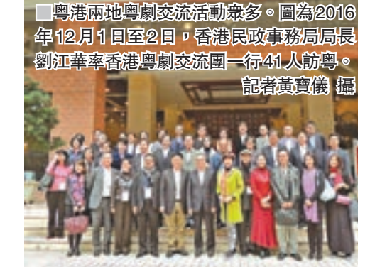
粵港兩地粵劇交流活動眾多。圖為2016年12月1日至2日，香港民政事務局長劉江華率香港粵劇交流團一行41人訪粵。

歐凱明認為，粵劇在粵港聯手拓展「一帶一路」文藝市場上很有優勢，雙方可以組織演員聯合排練具有嶺南文化特色的劇目，共同到「一帶一路」沿線國家和地區演出，既能促進兩地演員互相學習提升，又能擴大粵劇在世界範圍內的影響力。不過，歐凱明承認由於體制不同，香港演員靠市場生存，要聯合排練還需要政府支持並提供資助。