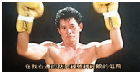
高飛在電影多演反派角色。網上圖片