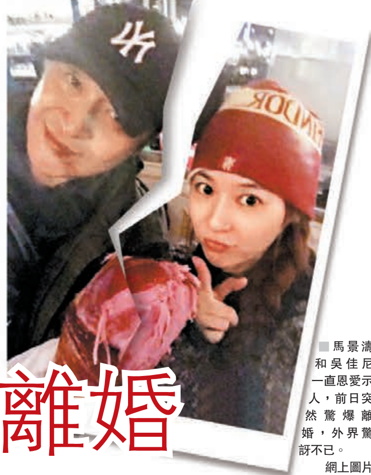
馬景濤和吳佳尼一直恩愛示人，前日突然驚爆離婚，外界驚訝不已。網上圖片