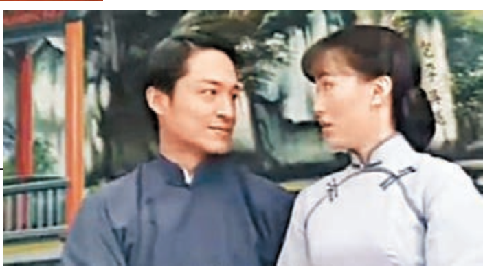
馬景濤較為港人熟悉是《再見艷陽天》。電視截圖