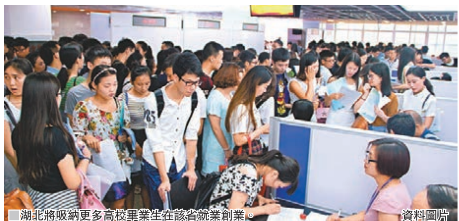
湖北將吸納更多高校畢業生在該省就業創業。

陳安麗指，湖北將打造全省城實習實訓基地，五年內擬在全省建立5,000個大學生實習實訓基地，積極推動政府機構和企業接納大學生實習實訓，並給予每人每月不少於500元(人民幣，約合港幣564元)的生活補貼，省級對各地按補貼總額的50%以獎代補給予支持。她續稱，湖北力爭五年內吸引超過200萬大學生在該省實習實訓，超過180萬高校畢業生就業創業。