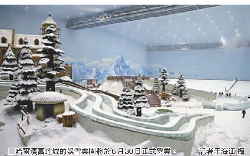
哈爾濱萬達城的娛雪樂園將於6月30日正式營業。

專家分析，目前資金「脫實向虛」的外部環境並不利於東北經濟的復甦，但2022年冬奧會的申辦成功為東北的文化旅遊產業特別是冰雪冰機帶來了良好的發展機遇；同時哈爾濱萬達城作為一種全新的文旅商業形態，為用戶提供全天候的旅遊、娛樂、購物、休閒服務，符合國家提出的「供給側改革」方向，有望成為東北經濟轉型樣板。