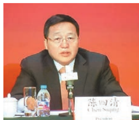
中行行長陳四清昨透過視像表示，已見到淨息差走勢出現企穩。

香港文匯報訊（記者 吳靜儀）中國銀行（3988）昨公佈，2016年股東應享稅後利潤倒退3.67%至1,645.78億元（人民幣，下同），每股收益0.54元，派末期息0.168元，同比少派0.007元。期內不良貸款總額1,460.03億元，比2015年末增加151.06億元；不良貸款率1.46%，上升0.03個百分點。中行行長陳四清於業績會上表示，全年累計化解不良資產1,289億元，按年升23.5%，不良風險可控；另外亦見到淨息差走勢出現企穩。