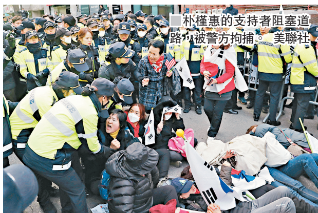
朴槿惠的支持者阻塞道路，被警方拘捕。