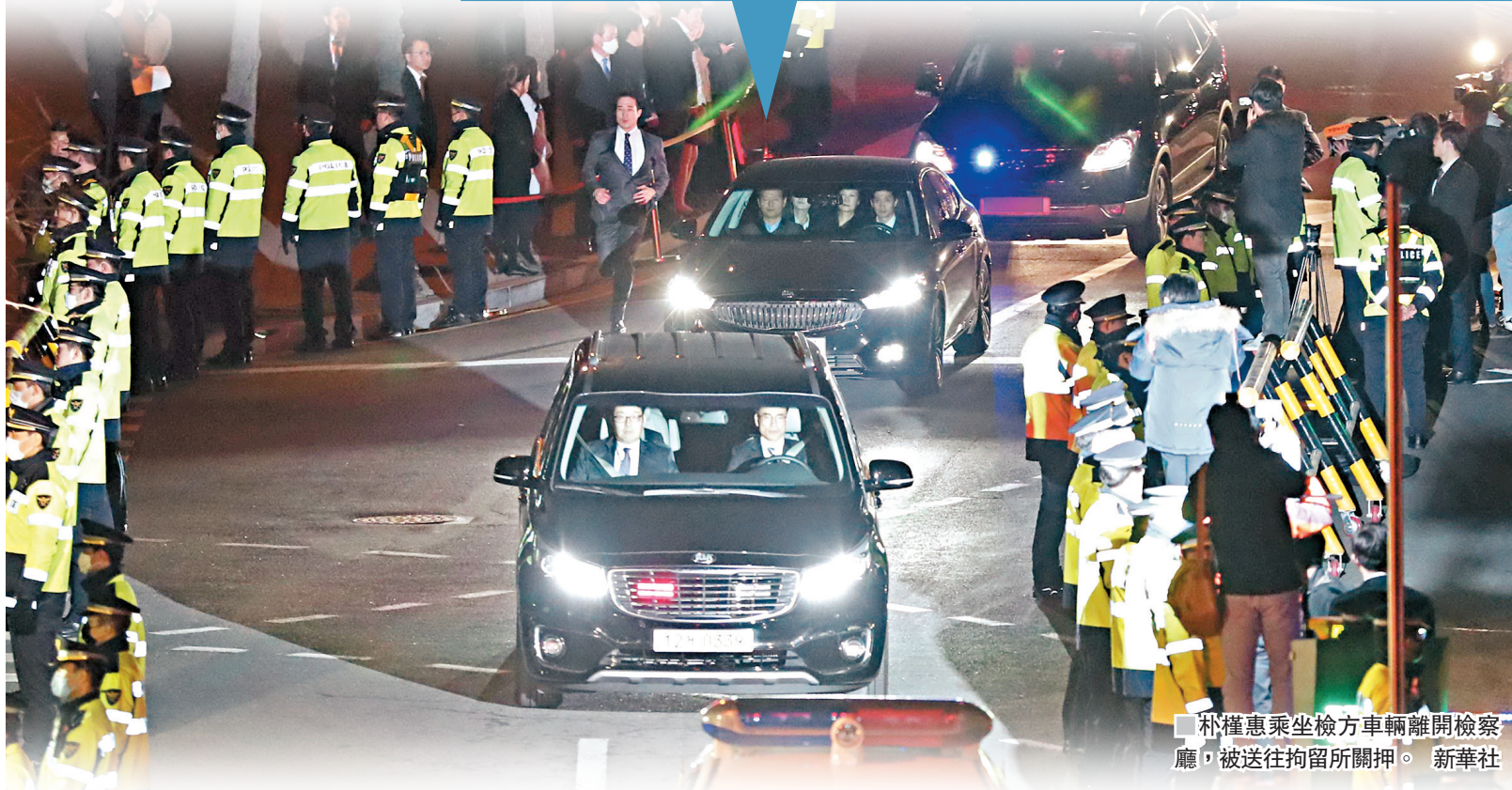
朴槿惠乘坐檢方車輛離開檢察廳，被送往拘留所關押。