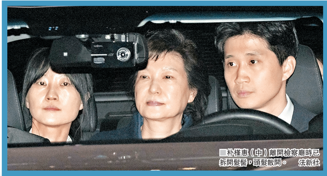
朴槿惠(中)離開檢察廳時已拆開髮髻，頭髮散開。

韓國首爾中央地方法院前日進行審訊後，昨日凌晨批准檢方申請針對前總統朴槿惠的拘捕令，她隨後正式被檢方拘捕，送往首爾拘留所關押，成為韓國史上第3位被捕的前總統。檢方將在本月19日屆滿的20日拘留期內，繼續對朴槿惠進行調查，同時爭取在17日總統大選競選活動開始前，正式對她提出公訴。司法界普遍認為，法院或於10月中旬對朴槿惠案作出一審判決。