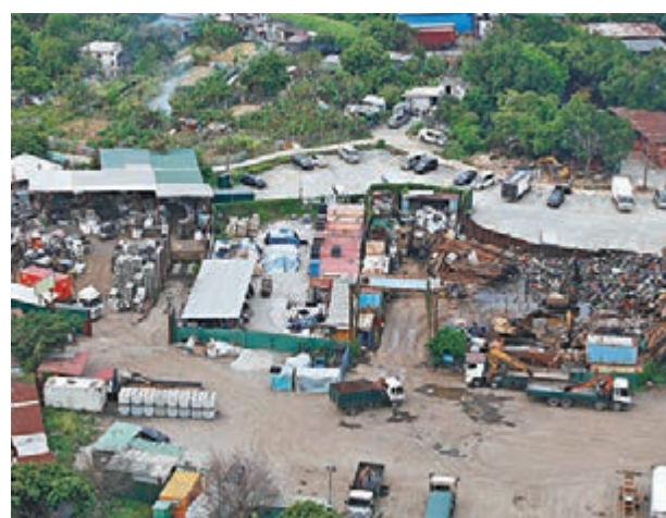
「棕地」使用及作業現況研究預料明年完成。圖為位於元朗的「棕地」。資料圖片

規劃署署長李啟榮透露,下月將展開新界棕地使用及作業現況研究,目的是要全面掌握新界棕地整體分佈及用途,協助政府制定政策及措施,預計明年完成。政府會在適當時候,就建議棕地政策大綱諮詢立法會及公眾。