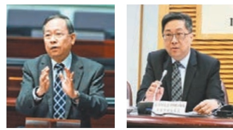
黎棟國(左)和盧偉聰(右)在會議中發言。

黎棟國期望,未來可增加入境事務處處理免遣返聲請的數量,目標是提高至一年內處理5,000宗或以上申請,也不排除會將旅客