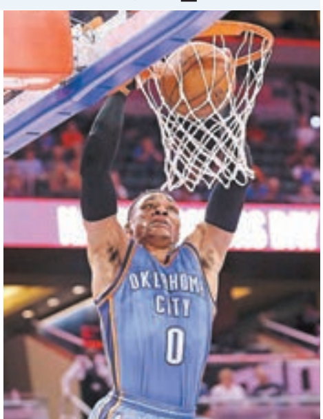
■韋斯布魯克不停創歷史。

韋斯布魯克續創紀錄，昨天NBA常規賽，他攻入57分及有13籃板和11助攻，刷新NBA史上「三雙」統計中的最高得分紀錄，幫助雷霆作客經加時以114:106擊敗奧蘭多魔術。 「韋少」當天率隊逆轉，也是雷霆隊史上單場落後最多分數下的逆轉。到第三節時，雷霆一度落後21，韋少勢不可當，在還剩7.1秒時延續末節強勢，以一記扳平比分的三分球拖入加時，最終助客隊取勝。韋少以本賽季個人第38次三雙再次導演翻盤好戲，這是雷霆繼27日扭轉13分劣勢反勝小牛後連續第二場逆轉勝。同日西岸雙雄對決，勇士一度落後22分下同告反勝，作客以110:98擊敗聖安東尼奧馬刺，9連勝，史提芬居里為勇士貢獻29分。