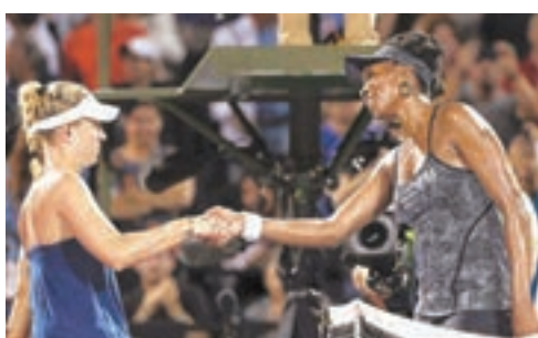
■卻芭(左)未能躋身下一圈。

卻芭之前在大威身上取得4勝2負較佳對賽成績。今仗雙方咬得甚緊，大威在第5局二度破發，隨後發球局沒守住，卻芭到第7局同樣化解破發危機，然而擁有先發優勢的大威領先6:5時，壓力卻在卻芭一方，隨着最終發球雙錯誤卻芭輸了第一盤。大威在第二盤亦穩住局面，對於男挫世界第一，大威謙稱：「我犯了比我想像中更多的失誤。」今年還未有冠軍的卻芭樂觀表示，雖然開季不理想，但仍會努力爭取重開勝利之門。