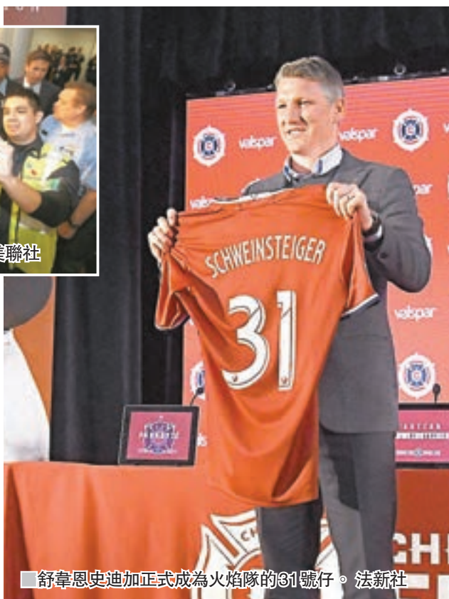
■舒韋恩史迪加正式成為火焰隊的31號仔。