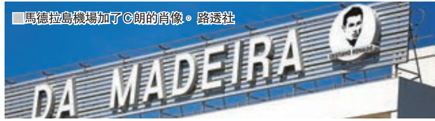
■馬德拉島機場加了C朗的肖像。

美斯辯稱爆粗非罵旁證 阿根廷在衝刺世界盃決賽周入場券最後階段，卻有入球靈魂美斯因上週對智利一戰中爆粗口辱罵旁證而被罰國際賽停賽4場。這位西甲巴塞羅那足球巨星昨日回應說：「當時我說話並非衝着人說的。」雖然阿足總會為美斯上訴，但完全免罰的機會並不大。受累上週國際賽期，巴塞的土耳其中場阿達杜倫因傷要缺陣3星期。