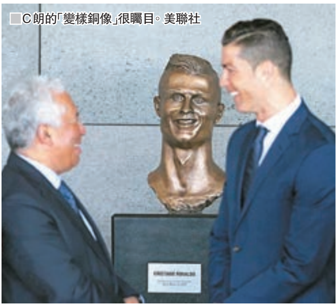
■C朗的「變樣銅像」很矚目。

葡萄牙馬德拉機場於當地時間29日正式更名為「基斯坦奴朗拿度」機場，表彰葡國足球巨星C朗為其家鄉帶來的榮耀。不過，在機場就見到了葡萄牙球王的醜爆銅像。