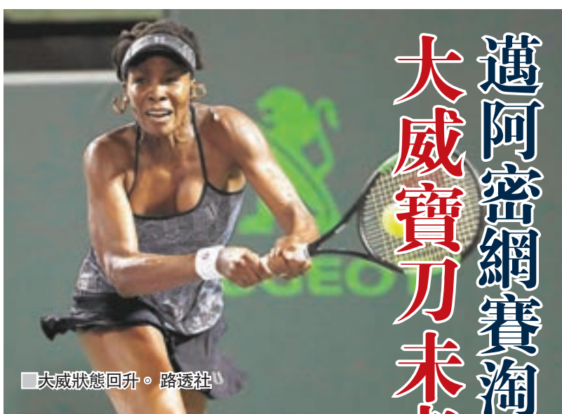
■大威狀態回升。