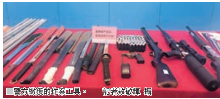
警方繳獲的作案工具。

此外,從3月初起,廣東警方還與港澳警方開展「雷霆17」專項行動,將跨境涉黑惡犯罪列為重點打擊對象之一,維護粵港澳地區社會治安穩定,為居民工作生活及各類經營活動創造良好的社會環境。