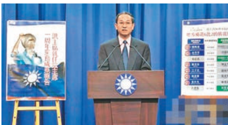
國民黨文傳會副主委唐德明。 網上圖片