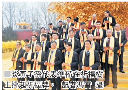
炎黃子孫代表準備在祈福樹上掛起祈福牌。

香港文匯報訊(記者 馮雷、劉蕊 河南報道)丁酉年黃帝故里拜祖大典昨日在河南新鄭舉行,來自40多個國