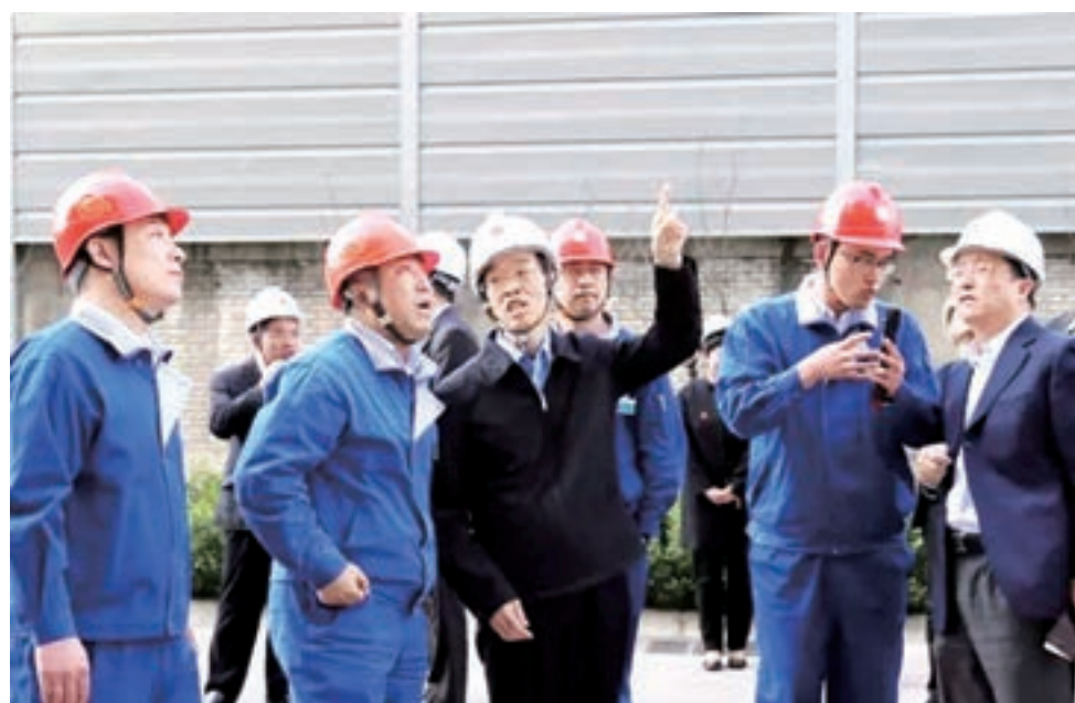
2016年3月29日，民革中央主席萬鄂湘率調研組實地考察河北省保定市大唐清苑熱電廠。

在經費方面，由中共中央統戰部給予經費支持；在智力方面，中共中央負責人主持調研協商座談會，邀請中央和國家機關有關部門領導和相關專家學者參加，就考察情況和調研報告提出意見和建議，幫助民主黨派中央補充和完善調研報告。除此之外，在後勤方面，由地方黨委辦公廳資源牽頭，會同黨委統戰部和政府有關部門共同落實調研方案，共同做好考察調研的接待和服務保障工作，為調研工作提供極大便利。