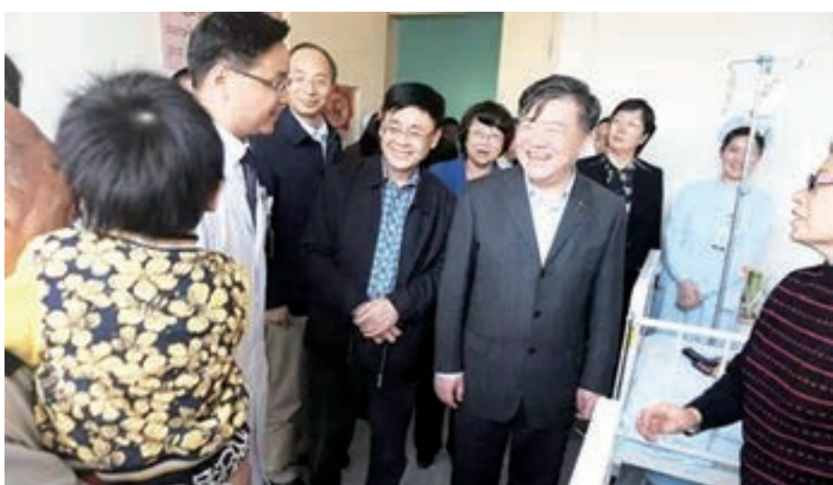
2016年4月，農工黨中央主席陳竺考察上海市公立醫院。