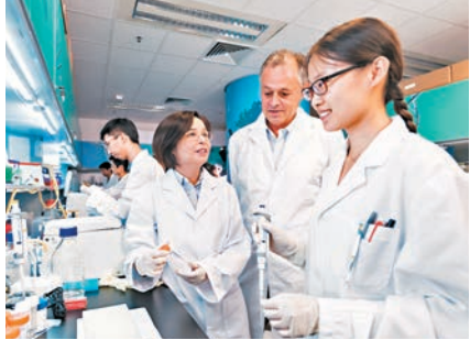
城大的獸醫學士課程開課時，可獲得臨時認證資格。圖為該校師生在實驗室情況。

香港文匯報訊（記者 黎恣）城市大學動物醫學院將在今年9月開辦本港首個自資獸醫學士課程，校長郭位昨日宣佈，該學院已獲得澳新獸醫管理局理事會（AVBC）認證小組發出「合理保證書」，學士課程開課時即可獲得臨時認證資格，認證小組會繼續考察課程的營運情況，確保課程達標；若一切順利，首批學生畢業時就可取得正式認證資格，在本港、英聯邦國家如英國、澳洲、新西蘭、加拿大等地執業。