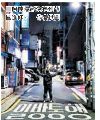
阿陸最終決定到韓國進修。

如果各位年輕人希望對工作世界有多些認識，可參與女青生涯規劃服務隊（香港島及離島）的工作體驗及實習計劃，詳情將於 facebook ( https://www.facebook.com/hkywcaclap ) 內刊登，大家快點報名參與啦。