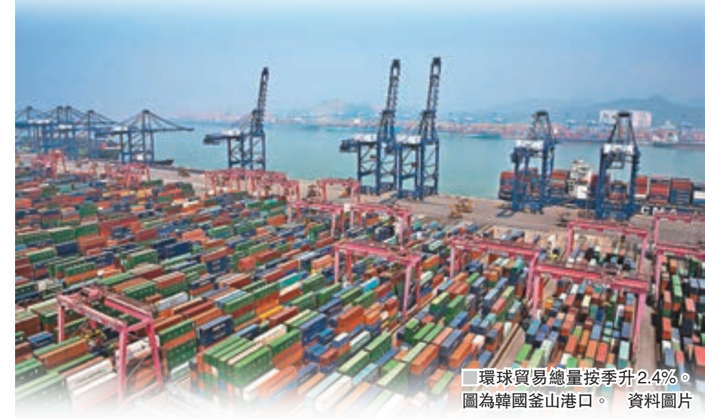
環球貿易總量按季升2.4%。圖為韓國釜山港口。

另外，新興市場的商品及生產出口在過去數季都錄得增長，拉美經濟體在生產出口方面表現出色，而韓國、中國及印尼等亞洲市場的情況也類似，反映主要新興市場已從經濟衰退中恢復，並帶動環球貿易維持增長。