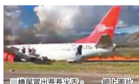
機尾冒出長長火舌。網上圖片

秘魯航空一架客機前日在中部城市豪哈著陸時，失事滑出跑道起火，機上141人及時疏散，無人傷亡。當局懷疑客機「硬著陸」是失事原因。肇事波音737客機著陸時失控，突然轉右滑出跑道，隨即起火，但航空公司強調沒有撞機，重申會徹查起火原因。網上流傳影片顯示，客機尾部起火，火舌長達數米，不停冒出黑色濃煙。