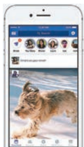
Direct與Snapchat的功能極為相似。

社交網站facebook(fb)近日多次推出新功能，都被指明抄襲對手Snapchat，fb前日再度更新手機應用程式(app)，更索性「抄到盡」，幾乎把所有仍未抄過的Snapchat功能，完全複製下來，包括與Snapchat的Stories同名的24小時限時刪除狀態，與Snapchat Snaps相似的閱後即焚訊息功能Direct，以及與Snapchat Filters相似的相機濾鏡功能Camera Effects。