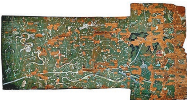
陝西漢墓中發現的最完整二十八星宿圖。

畫除了墓室入口南北兩側的執轡武士,還繪有騎馬圖、山巒圖、車馬出行圖、樓閣莊園、宴樂人物、祥禽瑞鳥等,色彩艷麗,極為精美。而最讓人歎為觀止的是,前後室券頂通繪有日、月、四象、二十八星宿和人物圖,並墨書註明星官名,儼然一幅宇宙星空的絢麗夜景。