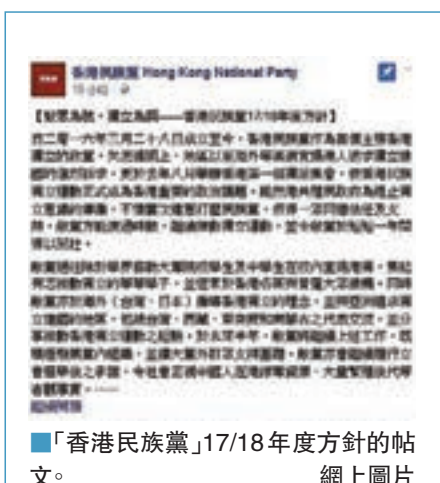
「香港民族黨」17/18年度方針的帖文。網上圖片

未來充滿期望，期望各界團結，積極推進民生、經濟，這是絕大部分香港市民想要的生活。鼓吹「港獨」者的言論明顯「離地」，目的是試圖破壞香港發展，與民意逆行。其他非建制派中人應該能看透「獨派」的真面目，並順應民意，一起向「港獨」分子「Say no」，而為杜絕歪風蔓延，當局應該積極研究為基本法第二十三條立法。