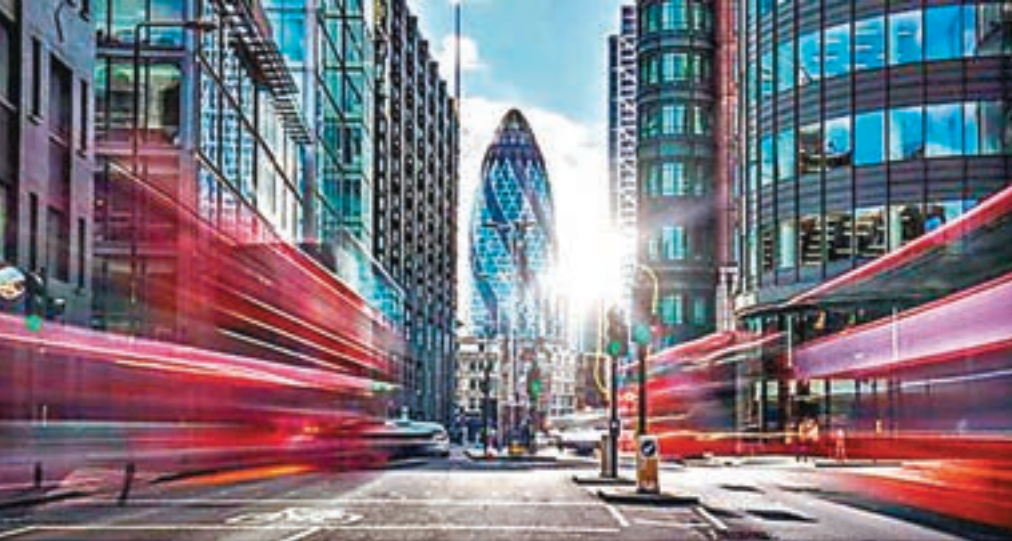
英國政府3月29日觸發里斯本條約第50條，展開為期兩年的脫歐談判。倫敦寫字樓將因部分銀行、保險業務轉移至歐盟而受影響。

英國政府今天(3月29日)觸發里斯本條約第50條，從而啟動為期兩年的英國脫歐程序。英國將會正式與歐盟啟動為期兩年的脫歐談判，但第50條並未對貿易協議作出任何規定。施羅德投資旗下分析師認為，短期股市因已消化上述消息不會有影響，隨着談判展開，銀行及保險商將繼續受到不明朗因素的影響。倫敦商業物業將因銀行及其他金融機構將部分業務轉移至歐盟而產生影響。