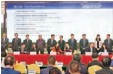
南沙與37家香港機構簽訂了合作協議。圖為簽約儀式現場。

香港文匯報訊(記者 帥誠 廣州報道)南沙昨日下午還與香港麗新集團等37家政府機構及企業簽訂了合作協議,涉及投資金額達1,162.3億元人民幣。其中,麗新集團文化創意產業總部