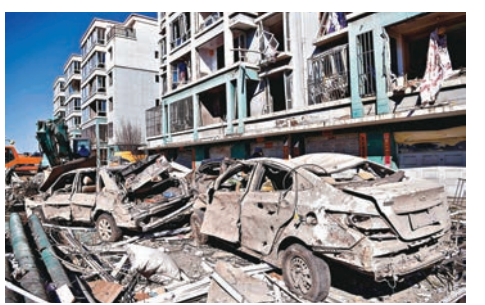
內蒙古25日發生爆炸事故,造成5死26傷。圖為事發現場。資料圖片

內蒙古包頭市土默特右旗滿門鎮北只圖村向陽小區居民樓上周六(25日)發生爆炸事故,造成五人死亡,26人受傷。當地公安機關前日通報說,該案涉嫌非法存儲爆炸物品犯罪。