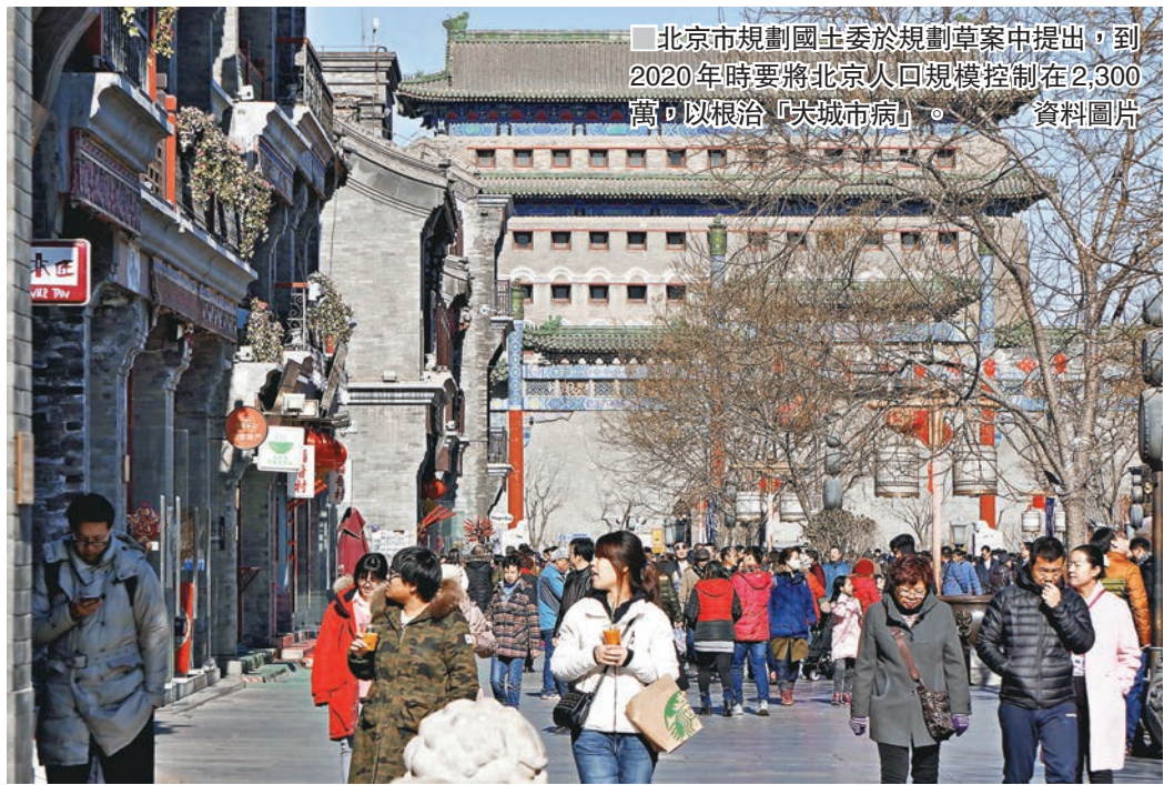
北京市規劃國土委於規劃草案中提出,到2020年時要將北京人口規模控制在2,300萬,以根治「大城市病」。

據悉,為充分徵詢和吸納公眾意見,相關部門會於今日起到下月27日在北京市規劃展覽館一層廳對草案進行公告。在參觀後,市民可以通過公告現場留言、市規劃國土委官網建言、發送電子郵件或信件等四種方式提出意見和建議。