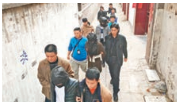
「颶風3號」專項行動成功打掉八個詐騙團夥,並抓獲450餘名疑犯。

香港文匯報訊(記者 敖敏輝 廣州報道)針對詐騙犯罪跨區域作案的新趨勢,廣東警方加大跨省追捕力度。近日,廣東警方組織「颶風3號」專項行動,赴11省對電信詐騙疑犯展開抓捕。行動成功打掉詐騙團夥八個,抓獲疑犯450餘人。