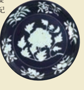
明宣德 藍地白花牡丹花果紋大盤

紐約蘇富比「中國藝術珍品」專場，場內老窯中最大的亮點莫過於來源於日本的建盞了，拍前一眾買家都在窺探它能否與去年臨宇山人的油滴盞比肩。這件南宋建盞黑釉兔毫紋雖然不到臨宇山人舊藏的那件價位，但也以848多萬元成交。同場的雍正粉青釉大茶葉瓶、乾隆/嘉慶一對粉彩地藏菩薩坐像、明16/17世紀銅鎏金銀犧尊，成交均為382萬元多。雍正仿汝釉鳩耳尊成交價近309萬元，乾隆銅仿古變龍紋朝冠耳三足大香爐、北宋/金白釉孩兒枕同是289萬元多成交，明17世紀黃花梨南官帽椅一對成交價近308萬元，天藍釉長頸瓶實拍得近175萬元。還有許多精品都拍出高價，因篇幅所限，無法一一盡錄。