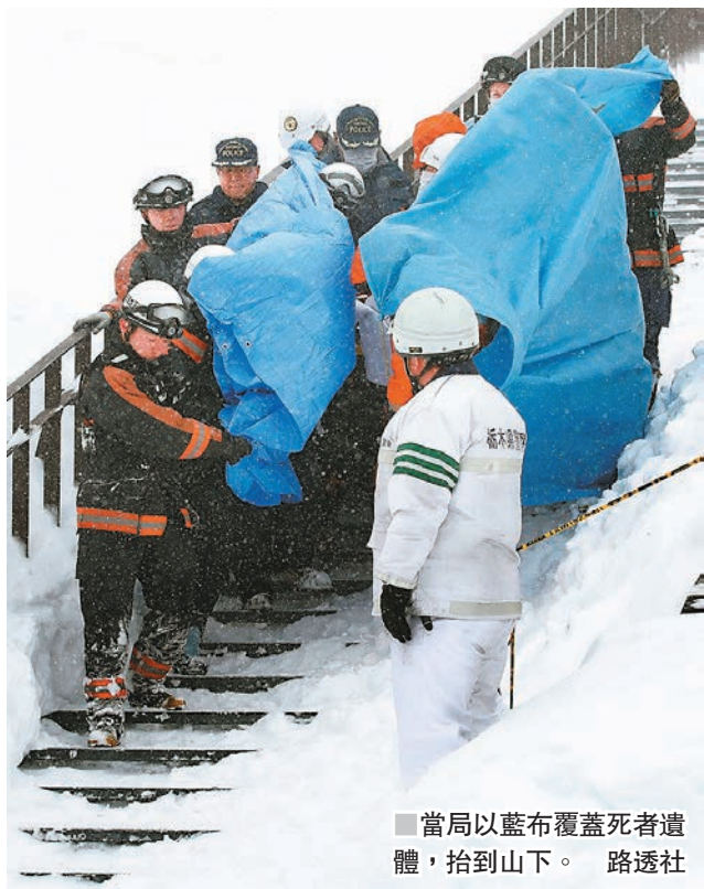
當局以藍布覆蓋死者遺體，抬到山下。

事發於那須町一個滑雪場附近，當地時間昨日上午9時20分(香港時間上午8時20分)，山上突然發生雪崩，正在登山的高中師生部分遭掩埋。當局接報後，派出自衛隊聯同消防部門共200多人到場救援，發現死傷嚴重。媒體報道，8名罹難師生均來自樺木縣立大田原高中，事件中另有48人受傷。拯救人員正搜索失蹤者。由於滑雪季節已過，當地滑雪場自周一起關閉。