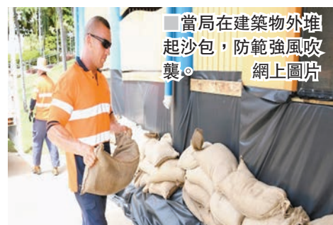
當局在建築物外堆起沙包，防範強風吹襲。網上圖片