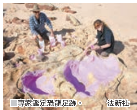
專家鑑定恐龍足跡。