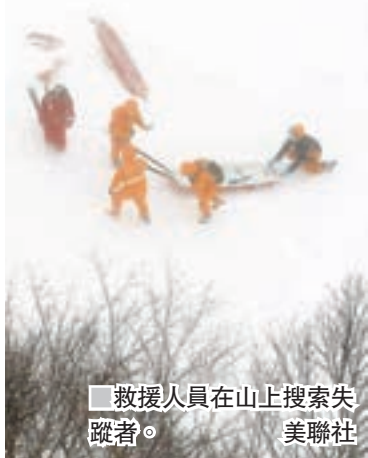
救援人員在山上搜索失蹤者。

日本東部樺木縣昨晨發生雪崩，當時正於事發地點登山的高中師生一度被困，8名來自同一間高中的師生被發現時心肺功能已停止，葬身雪山，該校另有4名師生失蹤。樺木縣政府事後要求自衛隊到場協助，惟因天氣惡劣令直升機無法飛抵現場，阻礙救援工作。