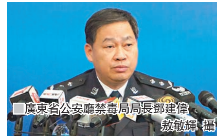
廣東省公安廳禁毒局局長鄧建偉。