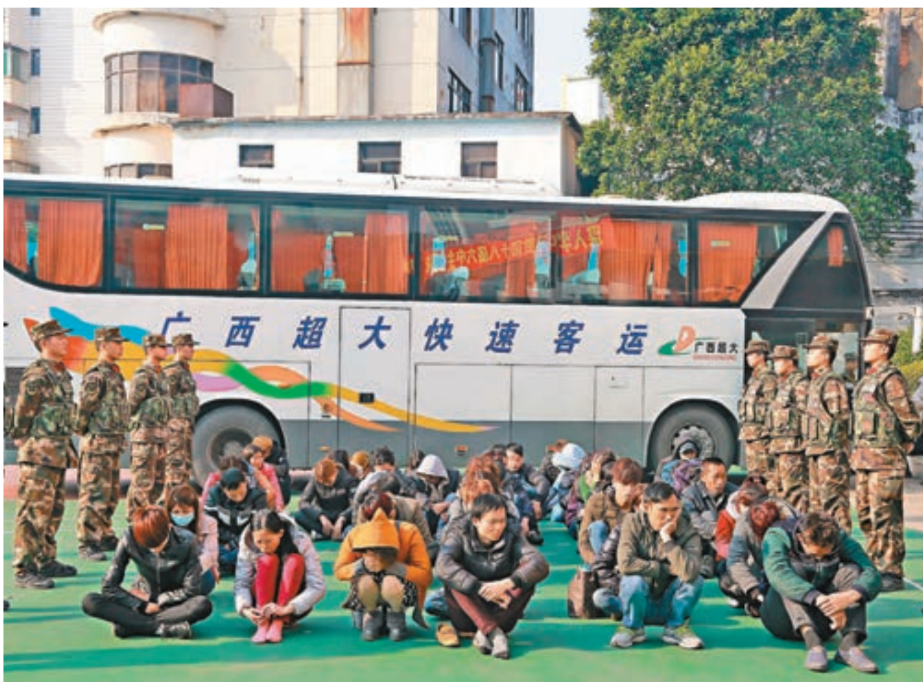
廣東陽江市公安邊防支隊官兵查獲一批非法入境外籍人員。

這些犯罪集團,組織嚴密、分工專業,而在具體操作上,偷渡路線更趨分散,成批組織境外人員進入廣東,或借道廣東進入香港,非法務工。在擾亂邊境管理秩序的同時,也滋生了盜竊、搶劫、販毒等犯罪活動。