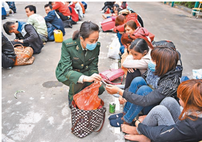
廣東珠海市公安邊防支隊官兵檢查外籍偷渡人員攜帶物品。