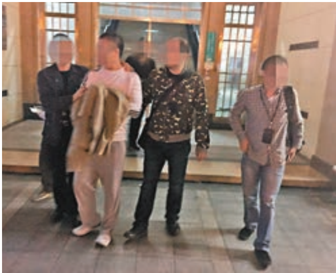
港籍主犯周某(左二)在東莞被抓獲。