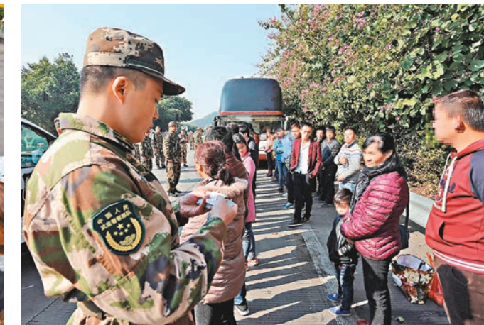
部分偷渡人員攜家帶口偷渡入廣東。