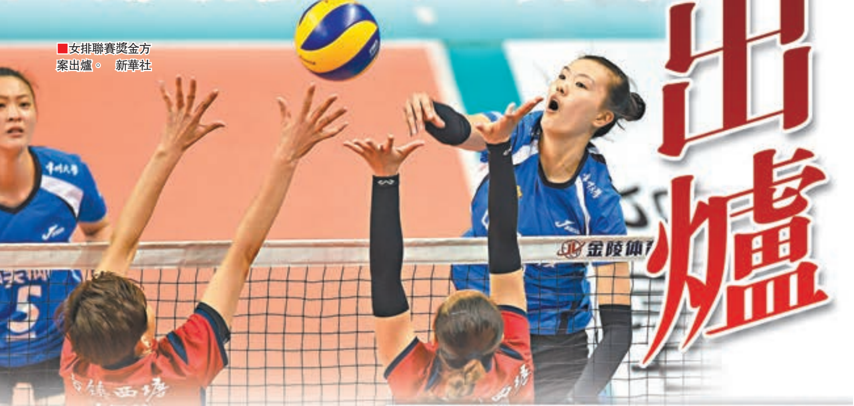
■女排聯賽獎金方案出爐。

香港文匯報訊(記者張聰北京報道)日前,「2017博鰲亞洲論壇體育之夜——體育大時代」在海南博鰲舉行,來自媒體、資本、學術界以及吳敏霞、惠若琪等知名運動員代表圍繞體育行業熱點展開討論。對於女排未來的發展問題,排球聯賽重要參與機構的負責人、體育之窗CEO高宏認為,女排關注度大幅提升,明年的女排聯賽獎金計劃翻倍,將由今年的1500萬上升至明年的3000萬元人民幣。