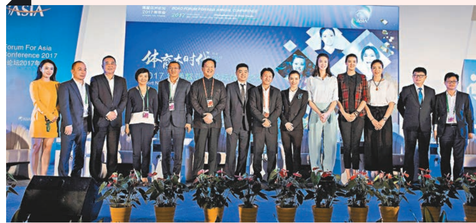
■眾體育名將出席活動現場。

再過幾天,他還將參加中國公開賽。他建議年輕運動員,除了關注自身的競技水平的提升,一定要多跟外界交流。 活動現場,鄒市明介紹起其在體育推廣方面的經驗。他表示,借助娛樂圈的方式,他將自身影響力不斷向外延伸,提高了社會對拳擊運動的認知。他認為,拳擊在中國是小眾項目,無法與三大球甚至桌球相提並論,未來會多參加一些綜藝活動,吸引更多關注中國拳擊、關注中國拳擊運動員。