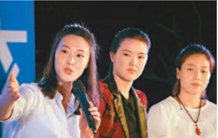
■惠若琪(左)等3位女排姑娘出席活動。