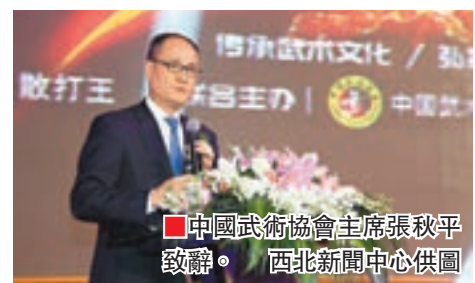
■中國武術協會主席張秋平致辭。

香港文匯報訊(特派記者唐瑜)日前,中國武術協會、國武時代國際文化傳媒(北京)有限公司在北京簽署了2017年世界超級散打王爭霸賽合作協議,並宣佈2017年世界超級散打王爭霸賽將於10月28日開賽。中國武術協會主席張秋平、副主席陳國榮等出席簽約儀式。著名的超級散打王柳海龍、王中王寶力高以及當年的各級別散打王楊曉靖、趙子龍、喬小軍等悉數亮相,當年散打王爭霸賽的著名教練員、裁判員也紛紛到場。