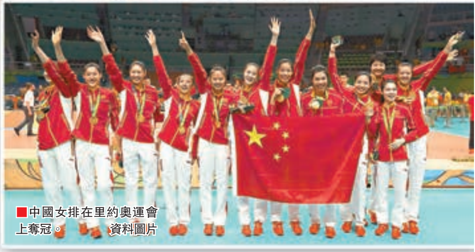
■中國女排在里約奧運會上奪冠。資料圖片

而來,例如賽期延長到5個月,賽場強制安裝LED屏幕、全部比賽啟用鷹眼系統等。其中全明星周末的恢復更是讓人眼前一亮。 里奧奪冠帶來難逢契機 對於女排未來的發展問題,排球聯賽重要參與機構的負責人、體育之窗CEO高宏認為,雖然女排得到了快速發展,關注度得到大幅提升,但要改進的地方還很多,其中之一便是運動員的自由流動問題。同時,他透露,明年女排聯賽獎金計劃將由今年的1500萬上升至3000千萬元人民幣。 高宏稱:「中國女排在里約奧運會上奪冠,給我們提供了一個千載難逢的契機,我們將與中國排球協會和各界一起,爭取將中國排球聯賽打造成世界最好的排球聯賽。」