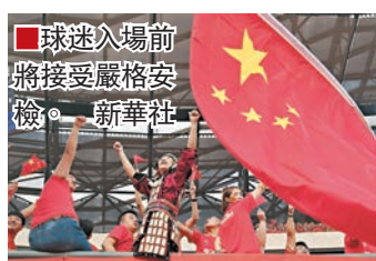
球迷入場前將接受嚴格安檢。

除了大量中國球迷之外，本場比賽還將有幾百名韓國球迷到現場。他們會被安排在固定的看台上，與中國球迷完全隔離開來。