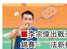
李宗偉出戰亞錦賽。

2017年亞洲羽毛球錦標賽將於下月25日至30日在武漢體育中心舉行，該項賽事男單衛冕冠軍李宗偉已經確認參賽。