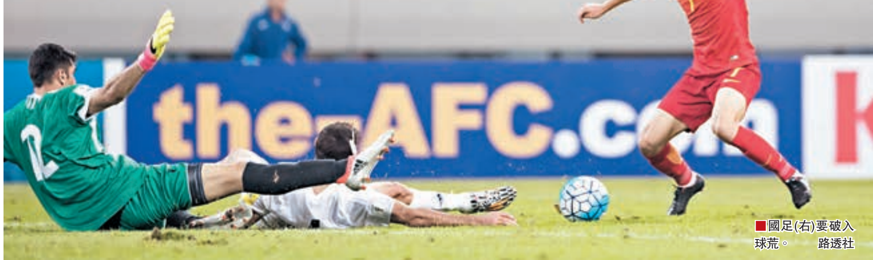
國足(右)要破入球荒。

除了大量中國球迷之外，本場比賽還將有幾百名韓國球迷到現場。他們會被安排在固定的看台上，與中國球迷完全隔離開來。