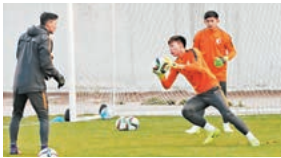
港足加緊備戰。