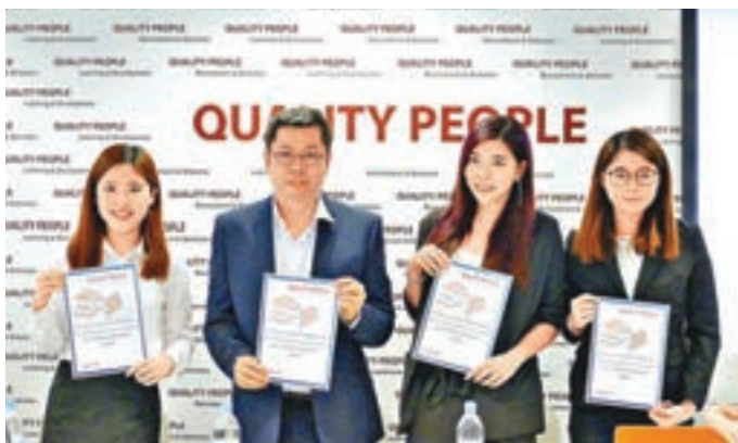
調查發現大部分學生希望透過補習提升應試技巧，其次是想得到考試提示。