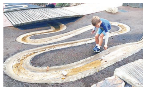
筆者在澳洲見識到當地不一樣的兒童遊樂場。

跟他們一起玩時，我再次融入孩子的世界內，大家一起大笑、一起尖叫，這些小孩毫不害怕認識新朋友。在這個社區中只要你願意放下拘束一起玩要，他們便樂意與你一起冒險，無分彼此。