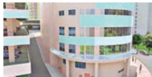
田灣商場將改建為國際學校。圖為Nord Anglia International School改建商場成學校後的模擬動畫。校網影片截圖