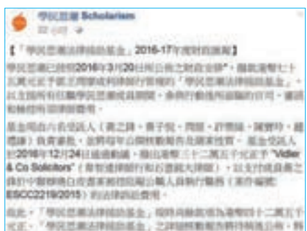
「學民」公佈「法援」賬目，河童是6名受託人之一。

香港文匯報訊（記者 羅旦）去旅行有人包旅費，連打官司都有人包訟費，仲要自己批界自己，都咪話唔過癮！已經「解散」的「學民思潮」，前晚在fb公佈了其「法律援助基金」的「賬目」匯報：在75萬元中，32.5萬都用係幫前「學民思潮」召集人、現「香港眾志」秘書長黃之鋒身上，其他同期都有官司在身的「學民」成員，例如林淳軒同林朗彥呢？唔通咁有錢自己畀晒錢打官司？最勁係黃之鋒（河童）自己係負責審批撥款嘅受託人之一，唔知算唔算有利益衝突？