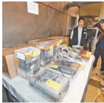
郵包軍火收藏在暖風機內。

機場亞洲空運中心早前亦曾揭發郵包軍火案。去年12月21日,海關人員在一個來自菲律賓馬尼拉的郵包內,發現藏有一支曲尺手槍、彈匣,及一批雷明登發彈槍零件;警方追查後於落馬洲路一個貨倉再搜獲一個可疑包裹,內藏有一支曲尺手槍零件及兩個彈匣,4名男子涉案被捕。