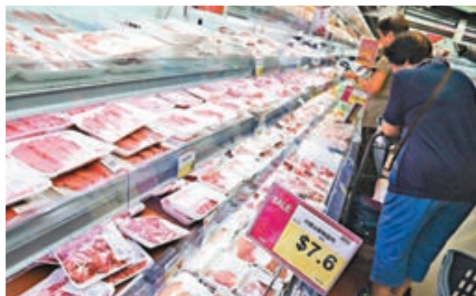
食安中心昨即時禁止所有巴西生產的冷藏及冰鮮肉類和禽肉進口。資料圖片

有家庭主婦稱,知道「黑心肉」事件後,擔心本港食安情況,直言「呢排唔會買巴西肉啦」。她續稱,以往會大約一周購買冰凍雞翼一次,當時無留意出產地,現在會留意下。巴西「黑心肉」醜聞於上周五爆發,巴