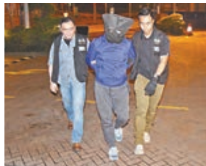
探員將涉軍火案男子拘捕帶署扣查。

香港文匯報訊(記者 鄺福強)海關早前在機場空運中心發現3個寄自外國的包裹藏有軍火,警方新界南總區重案組接手追查鎖定收件人,至昨日掩至水目標嫌疑人的工作地點及住所搜查,共檢獲6,600發子彈和5件槍械零件,一對從事物流業及營商的男女被捕並通宵扣留調查,警方正追查該批軍火的來源及用途。