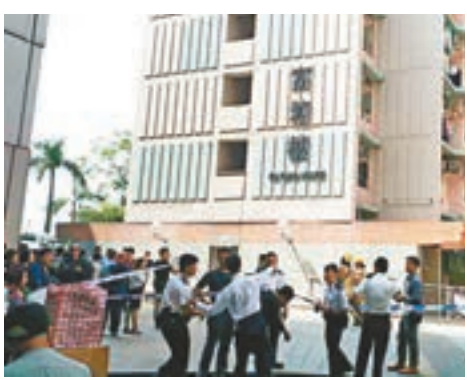
起火單位冒出濃煙,令附近樓層外牆熏黑。

分接報到場關掉相關氣喉,其間大廈1樓至36樓的同號數單位要暫停煤氣供應,至火警救熄後,受影響單位煤氣供應已陸續恢復。