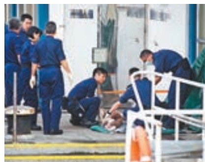
水警人員檢查失去頭顱的半裸女屍。

巴西肉品業龍頭JBS數十間較小的公司,共21間涉案,巴西冷凍食品協會指,1間被明令禁止出口肉類到香港,另外4間禁止出口到歐盟,5間要暫停營運,所有企業亦不得向巴西國內市場銷售有關肉品。