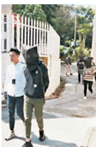
警方將涉案的2男1女拘捕帶署。

至昨早11時許,反黑組人員根據情報突擊搜查孟公屋村的目標單位,當場拘捕3名目標男女,並起獲3把牛肉刀、3把開山刀、1把長刀及1把木劍,全部帶署扣查。