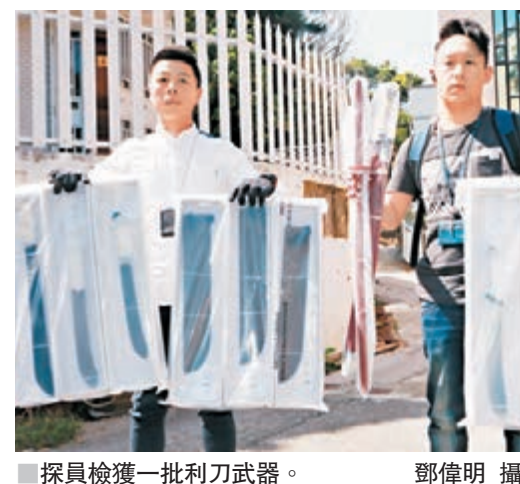
探員檢獲一批利刀武器。