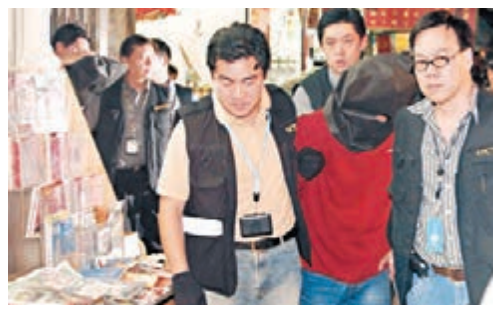
警方當年拘捕李姓男子。

香港文匯報訊(記者 杜法祖)一名曾先後干犯持械行劫及綁架案,共坐牢28年的悍匪,出獄後仍賊性不改,前晚竟易服戴假長髮,穿短裙、絲襪及高跟鞋扮女人,闖進中環鴨巴甸街一間時裝店亮刀脅持女店員打劫,惟對方受驚尖叫,驚動4名男途人撞破案件。有人事敗落荒而逃,惟最終被趕到警員拘捕。