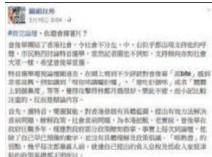
「鏡頭以外」呢篇質疑薯片的文章,就沒有受到傳媒青睞了。fb截圖

他稱,「首先,選特首,要選賢能,對香港發展有具體藍圖,提出有效方法解決當前問題,瞭(了)解政策、社會當前問題,為本港把脈。老實說,曾俊華在政府任職多年,理應對政府部分政策瞭(了)如指掌,事實上每次到論壇,他除了自己早已預備的數字,並沒