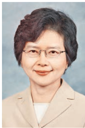
丁葉燕薇將出任候任行政長官辦公室秘書長(候任)。

丁葉燕薇1985年9月加入政務職系後,於2014年4月晉升為首長級甲級政務官。她曾在多個決策局及部門服務,包括房屋署、前常務科、前經濟科、前公務員事務局、前財政科、前資訊科技及廣播局、前工務局、公務員事務局及行政長官辦公室。她於2007年7月至2009年9月出任保安局副秘書長,2009年9月至2011年10月出任發展局副秘書長(工務),並從2011年10月起出任郵政署署長。